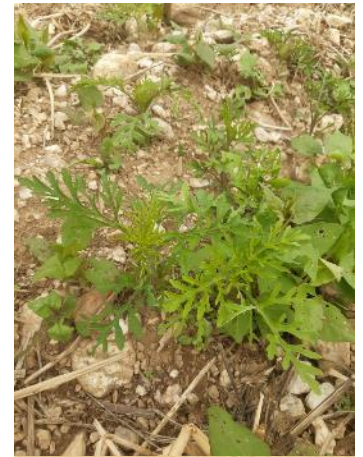
21/05/2021 ambrosies dans un champ dans le Tarn.