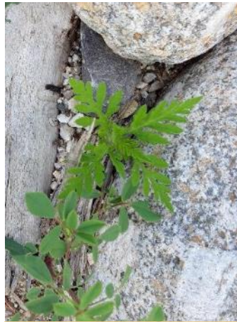
29/05 ambrosie en bord de rivière dans le Gard.

Période de croissance. Pas encore de levées d'ambrosies dans la vallée du Tarn en Lozère, mais on peut observer désormais des ambrosies à feuilles d'armoise aux stades 4 à 6 feuilles, dans le Gard.