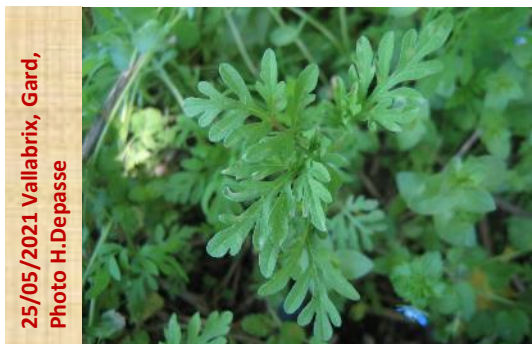
25/05/2021 Vallabrix, Gard, Photo H. Depasse