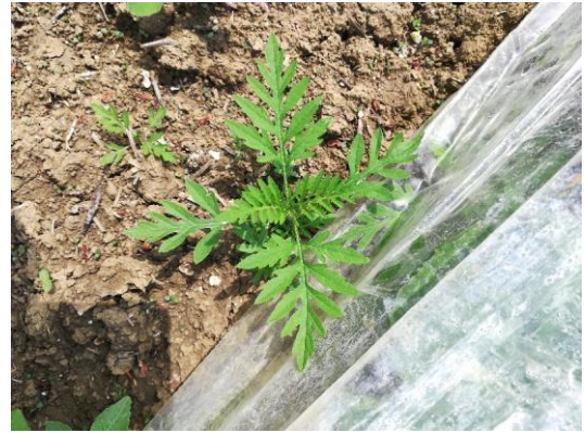
Ambrosie à feuille d'armoise en melonnière, le 15.05.2023 à Belfort de Quercy (46)

Sur terrain non perturbé mécaniquement (culture d'hiver, prairies...), les ambrosies sont également de sortie. Elles pousseront à la faveur des tâches clairsemées où elles profitent de la lumière. Sinon, elles attendront la moisson ou la fauche pour se développer en pleine lumière cet été (Cf photos ci-dessous, Gers et Lozère).