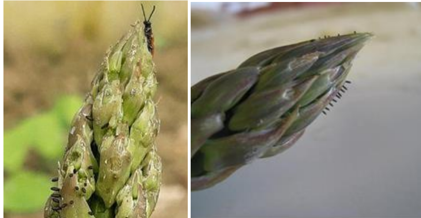
Criocères adulte et œufs