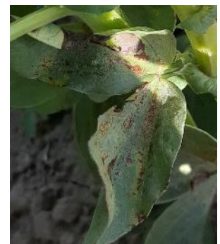
Botrytis sur fève

Techniques alternatives : L'utilisation de moyens de biocontrôle est possible. Liste des produits de biocontrôle . Contacter votre technicien.