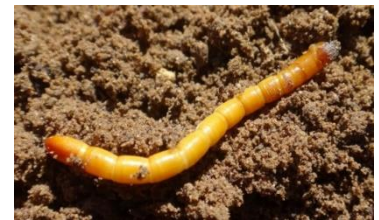
Larve de taupin- Photo JEEM

Lutte alternative : Possibilité de mettre du tourteau de ricin en fertilisation de fond, la ricine aura un effet sur les larves de taupin