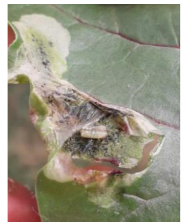
Mineuse larve sur betterave