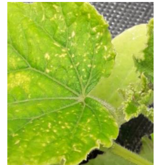
Dégâts acarien sur concombre