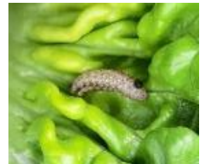
Noctuelle défoliatrice sur sucrine

Liste des produits de bio-contrôle . Contacter votre technicien.