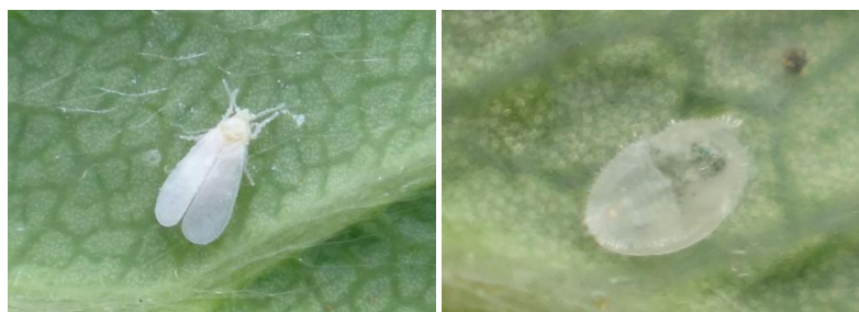
Adulte et pupa de Trialeurodes vaporariorum

- Possibilité de mettre en place des panneaux englués jaunes pour suivre le vol des aleurodes