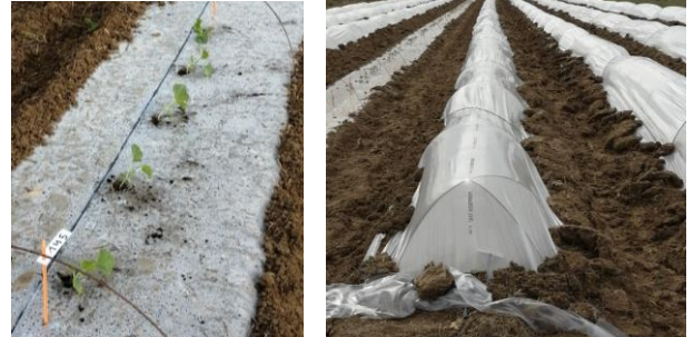
Forme Melon sous chenille

Les plantes les plus avancées sont au stade allongement des tiges et premières fleurs femelles. Les cultures sont vigoureuses. Attention au coup de chaleur. Si la température de feuillage dépasse 34°C, les chenilles fermées doivent être ouvertes.