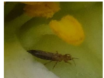
Thrips– Photo CA30

- Possibilité de mettre en place des panneaux englués bleus pour suivre le vol des thrips