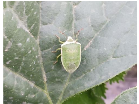
Punaise Nezara