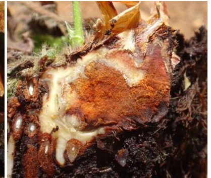
Symptômes Phytophthora – Photos CA30