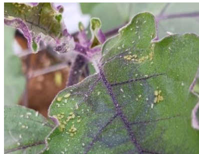
Foyer de pucerons