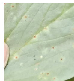
Rouille sur fève

Évaluation du risque : Risque en augmentation