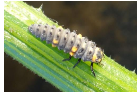
Larve de coccinelle

Nous observons une bonne présence d'auxiliaires indigènes comme les coccinelles mais qui dans certains cas seront pas suffisants pour gérer les foyers.