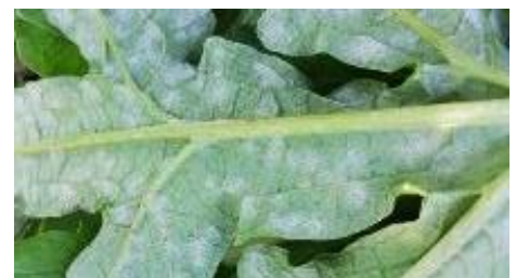
Oïdium sur artichaut