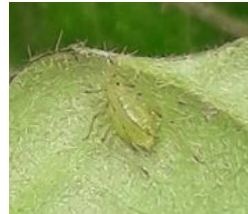
Aulacorthum solani