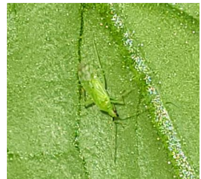
Mise en place de la confusion – Présence de Macrolophus - Photos JEEM