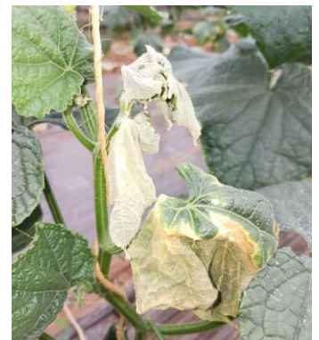
Brûlure tête de concombre

Techniques alternatives : Blanchir les tunnels.