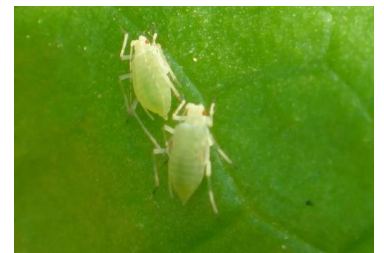
Puceron - Photo CA30

- L'utilisation de moyens de bio-contrôle est possible et efficace. Liste des produits de bio-contrôle . Contacter votre technicien.