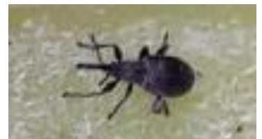
Apion sur artichaut

Les dégâts observés au printemps ont leur origine à l'automne lors des pics de pontes. Protéger les cultures contre l'apion entre octobre et novembre réduit les dégâts au printemps.