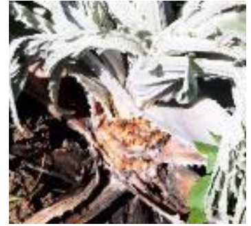
Sclerotinia sur artichaut