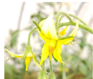
Marquage des fleurs par les bourdons