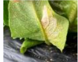
Mildiou sur sucrine

- L'utilisation de moyens de bio-contrôle est possible. Liste des produits de bio-contrôle . Contacter votre technicien.