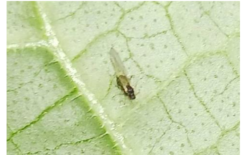
Pucerons sur concombre

Nous observons toujours des attaques de pucerons en particulier en Bio avec pour le moment des niveaux de populations qui restent assez faibles.... Les populations risquent de s'étendre au reste des cultures du fait de la présence d'individus ailés. La mise en place de plantes relais permet d'avoir de nombreux auxiliaires qui régulent les populations