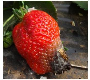
Botrytis – Photo CA30

Mesures prophylactiques : - Bien aérer les abris