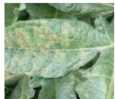
Mildiou sur artichaut sur feuille– CA66

Techniques alternatives : Des moyens alternatifs existent. Contacter votre technicien.