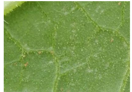
Forme mobile d'acariens