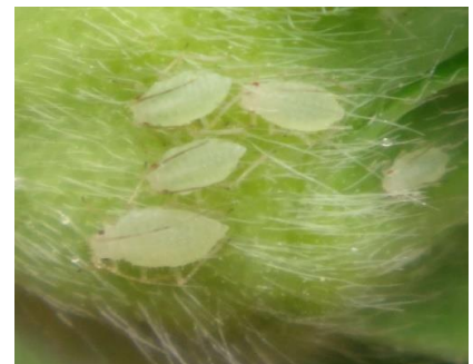
Foyer de pucerons – Photo CA30

On observe toujours des attaques de pucerons de manière généralisée en particulier en culture biologique, ou de manière plus localisée avec la présence d'individus aptères et d'individus ailés...qui peuvent se propager rapidement dans les cultures. Nous voyons de manière plus régulière des auxiliaires indigènes comme des larves de syrphes