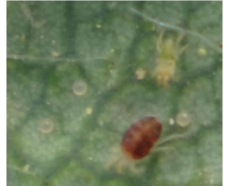
Acariens Forme mobile et œufs Photo CA30

- Possibilité des faire des lâchers d'acariens prédateurs, de manière préventive avec Neoseiulus californicus et sur foyers en cas de forte pression avec Phytoseiulus persimilis qui met 2-3 semaines à s'installer (faire des lâchers anticipés).