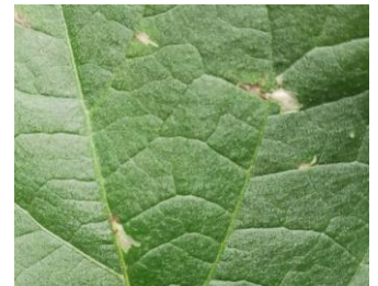
Tuta absoluta