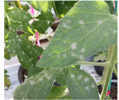
Oïdium tomate