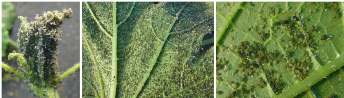
Foyers de pucerons sur courgette