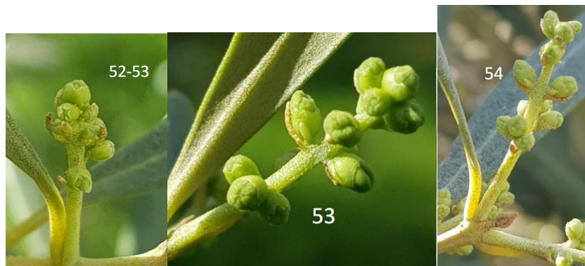
Stades phénologiques 52 à 54 (échelle BBCH).

BBCH 54 : Les bouquets floraux s'allongent.