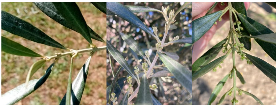
De gauche à droite : Stade BBCH 50, variété Aglandau à Saint Gilles (30) le 19 avril, source CTO ; Stade 52 à Fourques (30), le 15 avril. Source : Corinne Barge (CIVAM 13) ; Stade 53 variété Olivière à Palau del Vidre (66) le 18 avril, source : Margaux Allix (CIVAM BIO 66).

En fonction des secteurs et des variétés, les bouquets floraux s'allongent ou les inflorescences se développent (1 à 3 étages formés).