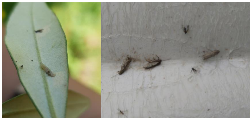
Larve qui sort de sa galerie et papillons piégés de la génération phyllophage, source : Centre technique de l'Olivier.

Pour plus d'informations, consultez la page sur la teigne sur le site de France Olive . Vous pouvez également consulter l'article dédié dans le Nouvel Olivier N°127.