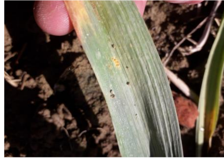
Rouille, premières pustules sur ail violet -CA31

Mesures prophylactiques : Privilégier les parcelles bien exposées et séchant vite. Eviter les zones de bas-fonds. Ne pas planter trop précocement. Raisonner la fertilisation et bien positionner les irrigations. D'une manière générale, favoriser un bon développement végétatif de la culture pour limiter l'impact sur le feuillage... Référez-vous aux fiches 1, 3, 4 et 5 du Guide de la production d'ail en Occitanie .