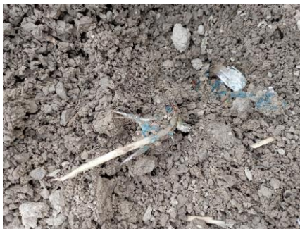
Penicillium – Photos : cefel

Le Penicillium est toujours observé sur l'ensemble des parcelles avec une augmentation modérée mais bien présente, à l'exception d'une parcelle en Haute-Garonne où il n'est plus présent. Les observations vont de 1 % à 10 % en ail rose, de 5 % à 10 % en ail blanc et de 0 à 1 % en ail violet. Les situations sont contrastées.