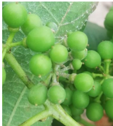
Symptômes sur pédicelles