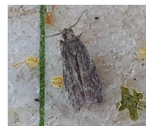
Papillon d' Ephestia