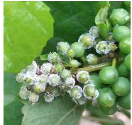
Mildiou : faciès rot gris

Ces symptômes sont, à ce jour, peu nombreux mais la situation peut évoluer suite aux pluies orageuses survenant depuis le 05 juin. De plus, l'augmentation des températures est favorable au raccourcissement des cycles de la maladie et donc à une apparition plus rapide des symptômes.