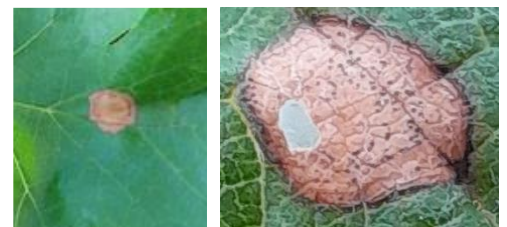
Symptômes de Black rot sur feuille