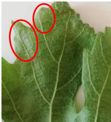
Symptômes sur feuilles