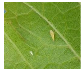
Cicadelle de la flavescence dorée (L1 et L3)

Quelques rares larves sont visibles au vignoble.