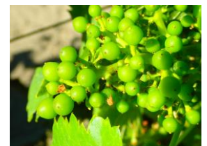
« baies à taille de pois » (stade 3 ou K ou BBCH 75)

Le stade majoritairement observé est « baies à taille de pois » (stade 31 ou K ou BBCH 75).