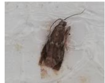
Papillon de Cryptoblabès gnidiella

Des papillons sont relevés (effectifs de 0 à 7) dans certains pièges du Minervois, du Biterrois et de la Basse Vallée de l'Hérault. Ils sont relevés dans les pièges de la pyrale du Daphné.