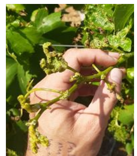
Galles phylloxériques sur apex de vigne