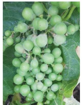
Symptômes sur grappes