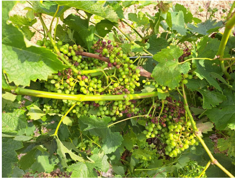
Symptômes de mildiou sur grappes (rot brun)