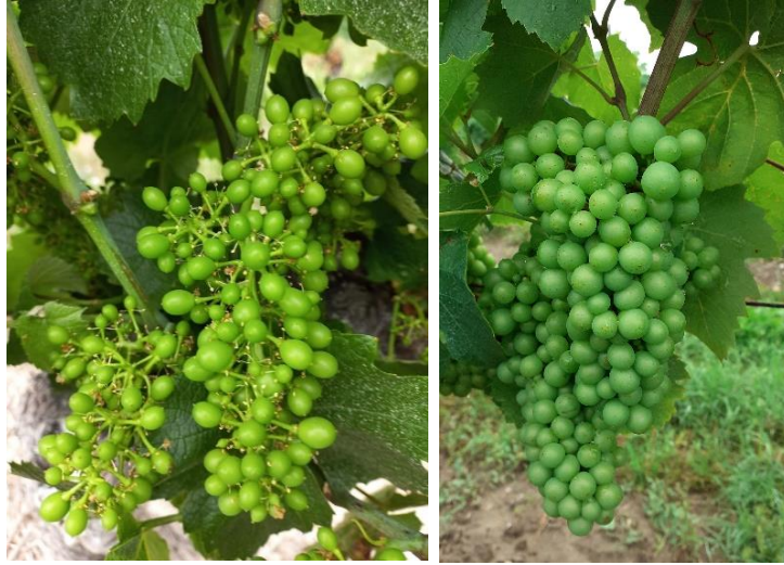
Stade 31 : Grains de pois