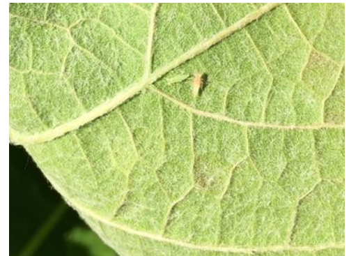
Larves de cicadelles vertes à 2 stades différents L2 et L4

Évaluation du risque : La gestion du ravageur repose sur une surveillance des populations larvaires. Ce ne sont pas les adultes mais les larves qui sont à l'origine des dégâts de grillure.