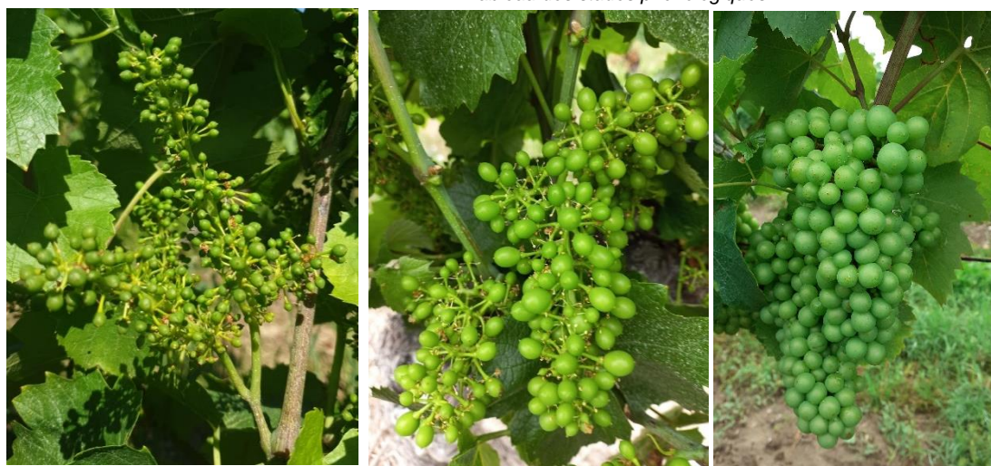
Stade 29 – Grains de plomb