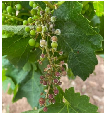
Rot gris et rot brun sur une même grappe