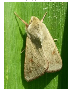
Papillon d' H. armigera