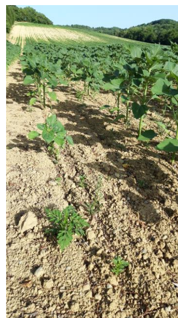
Ambrosies dans une parcelle de tournesol (photo prise le 14/06/2022 dans l'ouest audois)