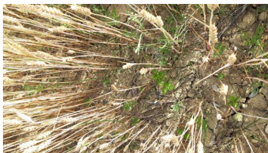
Ambrosies dans une parcelle de céréale à paille (photo prise le 14/06/2022 dans l'ouest audois)

En ce mois de juin très sec, les ambrosies dans les cultures d'hiver sont là en attente... Elles mesurent entre 5 et 10 cm et ne concurrencent pas la culture. Mais dès que la moisson aura libéré l'espace et la lumière, les ambrosies se développeront rapidement. Il faudra les détruire mécaniquement en interculture dans les chaumes avant la floraison.