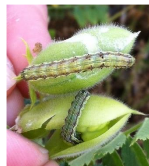
Chenilles d' H. armigera dans gousses de pois chiche

Période de risque : de l'apparition des premières gousses à la sénescence