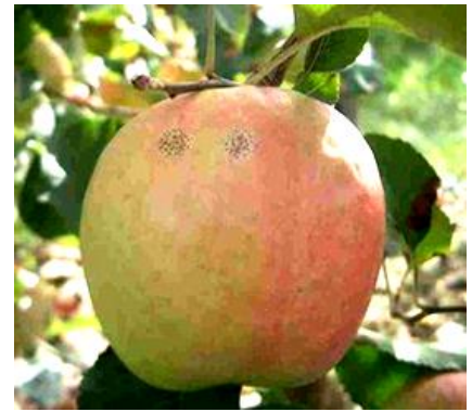
Maladie des « crottes de mouche »

On n'observe pas pour l'instant de sorties de taches.