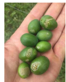
Dégât escargot, Photo Maxime Delbouis Qualisol 2023

En se nourrissant directement sur les fruits, il cause des dégâts avec ses mandibules en plus de créer des portes d'entrée pour différentes