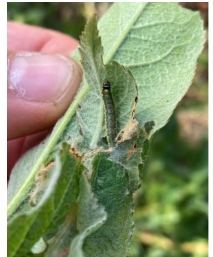
Dégâts et larve de capua sur pousse : feuilles collées entre elles avec tissage blanc

Mesures prophylactiques : la lutte par confusion sexuelle permet de limiter les populations et de diminuer l'usage des insecticides tout en améliorant l'efficacité de la protection. Les diffuseurs doivent être mis en place avant le début du vol (fin avril).