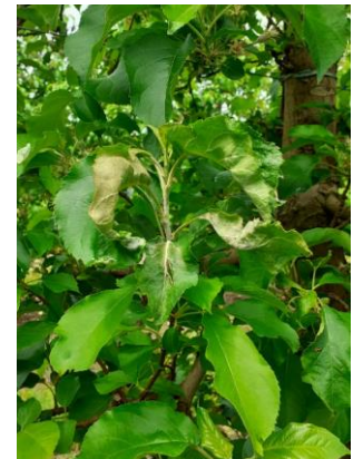
Pousse oïdiée ou « drapeau »

Mesures prophylactiques : La suppression des pousses oïdiées dès leur sortie permet de limiter les risques de repiquages.