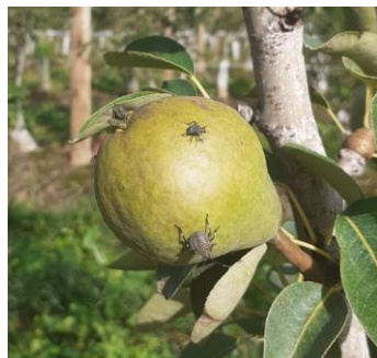
Larves de punaise diaboliques sur poire

Évaluation du risque : Risque localisé. A surveiller à la parcelle.