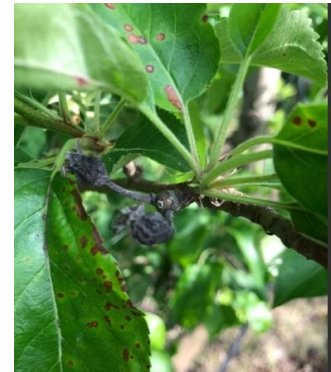
Black rot sur feuilles et momies

Évaluation du risque : Les périodes de pluie avec des températures douces sont favorables aux contaminations. Le risque est très lié à la parcelle.