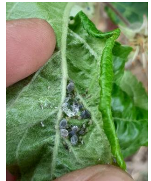
Foyer de pucerons cendrés