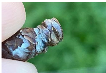
Œufs de psylles

Évaluation du risque : éclosions de la G3 en cours