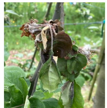
Pousse moniliée

Mesures prophylactiques : La suppression des pousses moniliées permet de limiter l'inoculum.