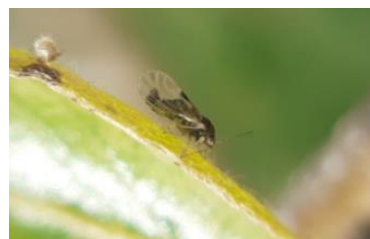
Psylle adulte