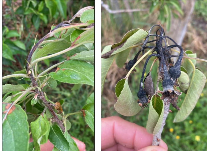
Symptômes de feu bactérien sur pousses (pommier à gauche, poirier à droite)