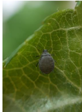
Fondatrice de pucerons cendrés