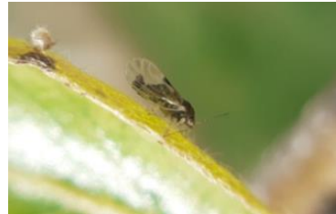
Psylle adulte