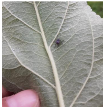
Jeune larve (L1) de punaise diabolique

Évaluation du risque : Risque localisé. A surveiller à la parcelle.