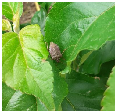
Adulte de punaise diabolique en verger