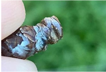
Œufs de psylles

Évaluation du risque : éclosions de la G3 en cours