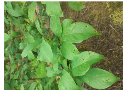
Taches et criblures bactériennes

Évaluation du risque : Risque fort. Les conditions humide et pluvieuse de cette semaine sont favorables aux bactérioses.