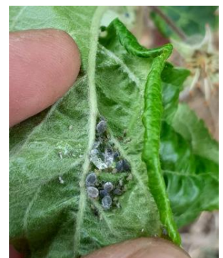
Foyer de pucerons cendrés