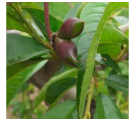
Fruit double, Photo CA82 2023

De nombreux fruits doubles, triples voir quadruples sont observés sur diverses espèces. Habituellement vu en cerisier, nous en voyons cette année sur des pêchers, nectarines et pruniers. Leur présence est le résultat des fortes chaleurs de l'été dernier au moment de l'induction florale.