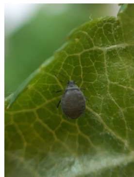
Fondatrice de pucerons cendrés - Photo CA82

Nous observons également la présence de larves de syrphes dans certaines parcelles.