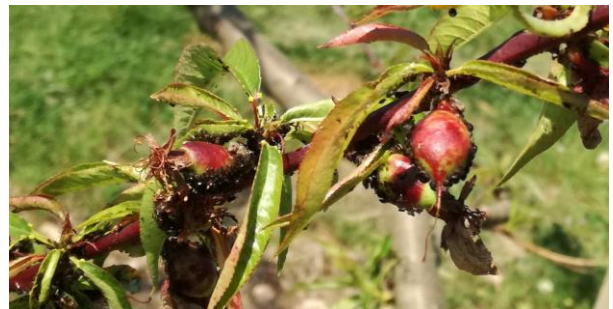
Puceron noir sur pêcher

Des foyers sont observés avec de nombreux auxiliaires.