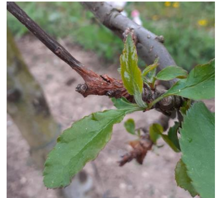
Chancre à nectaria

Période de risque : Les risques de contaminations sont quasi continus en période de pluie, de la fin de l'hiver (fin janvier-début février) à l'automne, dès lors qu'il y a des portes d'entrée au niveau du végétal (plaies de taille, grêle, floraison, chute des feuilles...).