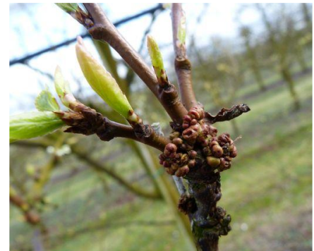
Galles de phytoptes sur September Yummy Photo CA82 (mars 2017)

La présence de phytoptes à galles (acaréens) se repère par l'apparition à la base des bourgeons, de galles rondes, brunâtres, de 2mm de diamètre environ. Celles-ci sont provoquées par une réaction du végétal à l'effet des piqûres des acaréens. A l'intérieur des galles, les tissus ont une couleur lie de vin. Les femelles qui hivernent dans ces galles migrent au printemps sur d'autres bases de bourgeons plus jeunes pour les parasiter. Sur les arbres atteints, on observe des bouquets de mai et des dards mal formés, des pousses à entre-nœuds courts, mal aoûtées. En cas de fortes attaques, la présence des phytoptes induit des défauts de floraison importants voire une absence de bourgeons à fleurs dans certaines situations (source : La Prune d'Ente, D. Carlot, 2004).