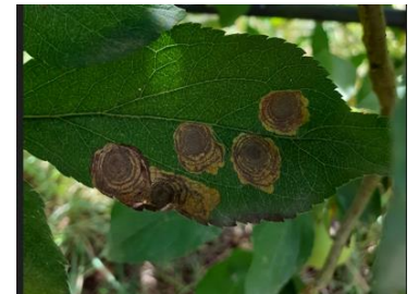
Dégâts de mineuses cerclées

Évaluation du risque : le 1 er vol est en cours