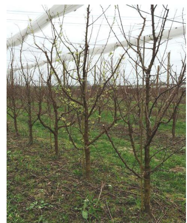
Arbre malade à feuillaison précoce

L'expression des symptômes est importante encore cette année en verger.