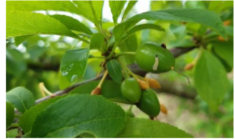
Hoplocampe, Photo 2023

Mesures prophylactiques : la lutte par pulvérisation de nématodes est conseillée au moment des toutes premières captures (il est donc trop tard pour cette méthode). Elle permet en théorie de limiter les populations et donc de diminuer l'usage des insecticides (efficacité attendue dans des conditions optimale : environ 50%).