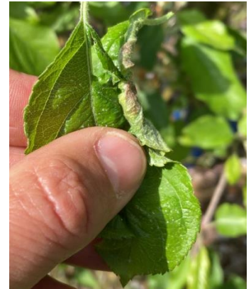
Dégâts de cécidomyies

Évaluation du risque : début de la période de risque pour l'instant. Seuls les jeunes vergers sont exposés au risque cécidomyie. Faible pression.