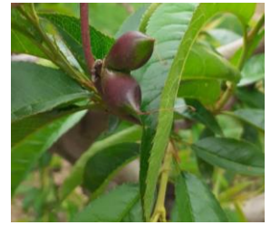
Fruit double, Photo CA82 2023

De nombreux fruits doubles, triples voir quadruples sont observés sur diverses espèces. Habituellement vu en cerisier, nous en voyons cette année sur des pêchers, nectarines et pruniers.