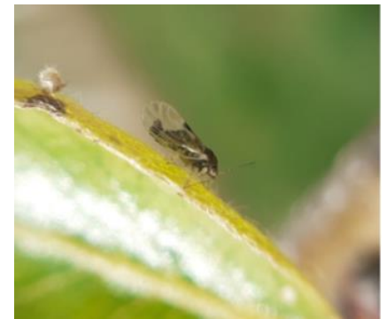
Psylle adulte - Photo CA82

Évaluation du risque : absence de risque pour l'instant