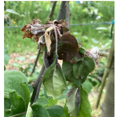
Pousse moniliée

Mesures prophylactiques : La suppression des pousses moniliées permet de limiter l'inoculum.