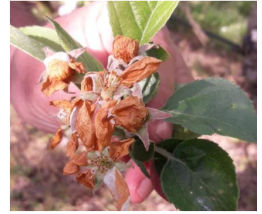
Dégâts d'anthonomes en « clou de girofle »

Évaluation du risque : fin de la période de risque