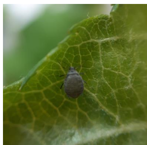
Fondatrice de pucerons cendrés