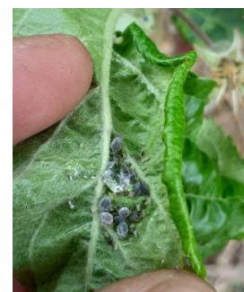
Foyer de pucerons cendrés