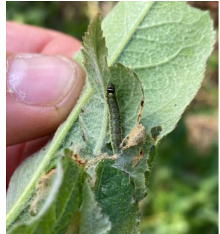
Dégâts et larve de capua sur pousse : feuilles collées entre elles avec tissage blanc

Mesures prophylactiques : la lutte par confusion sexuelle permet de limiter les populations et de diminuer l'usage des insecticides tout en améliorant l'efficacité de la protection. Les diffuseurs doivent être mis en place avant le début du vol (fin avril).