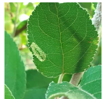
Dégâts de mineuses marbrées

Évaluation du risque : le 1 er vol est terminé