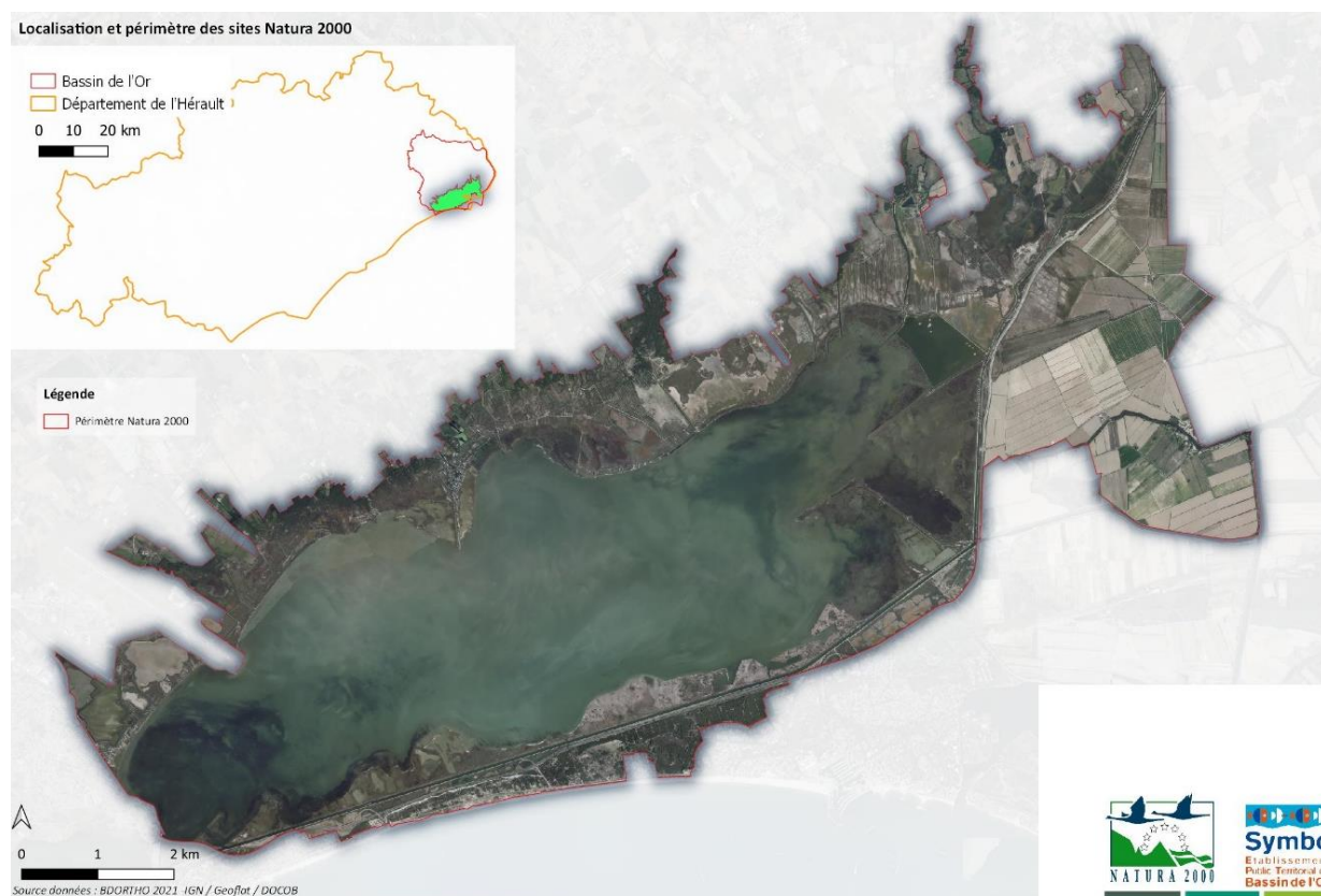
Périmètre du territoire « Etang de Mauguio » (OC_ETMA)

Le périmètre du territoire « ETANG DE MAUGUIO » est le périmètre commun aux sites Natura 2000 ZPS FR9112017 et ZSC FR9101408.