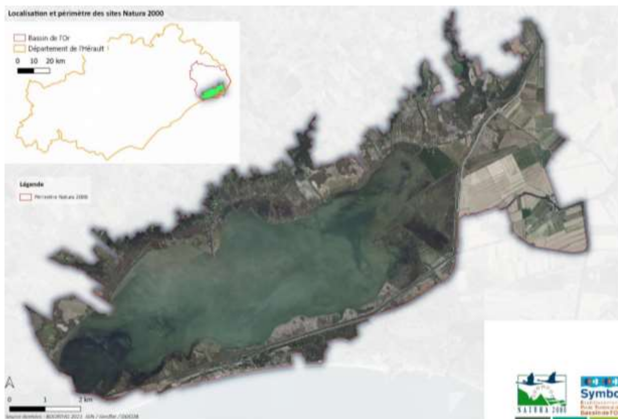
Périmètre du territoire « Etang de Mauguio » (OC_ETMA)

Le périmètre du territoire « ETANG DE MAUGUIO » est le périmètre commun aux sites Natura 2000 ZPS FR9112017 et ZSC FR9101408.