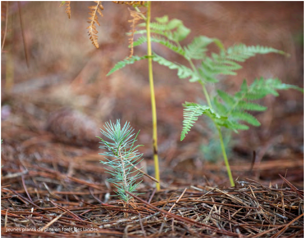
Jeunes plants de pins en forêt des landes.