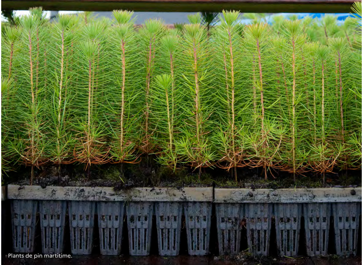
Plants de pin maritime.