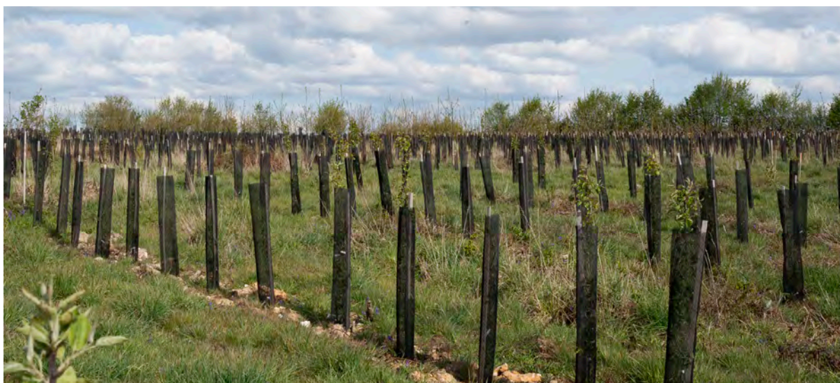
Parcelle expérimentale réalisée avec l'Inra et des pépiniéristes pour permettre le croisement génétique des différentes espèces.