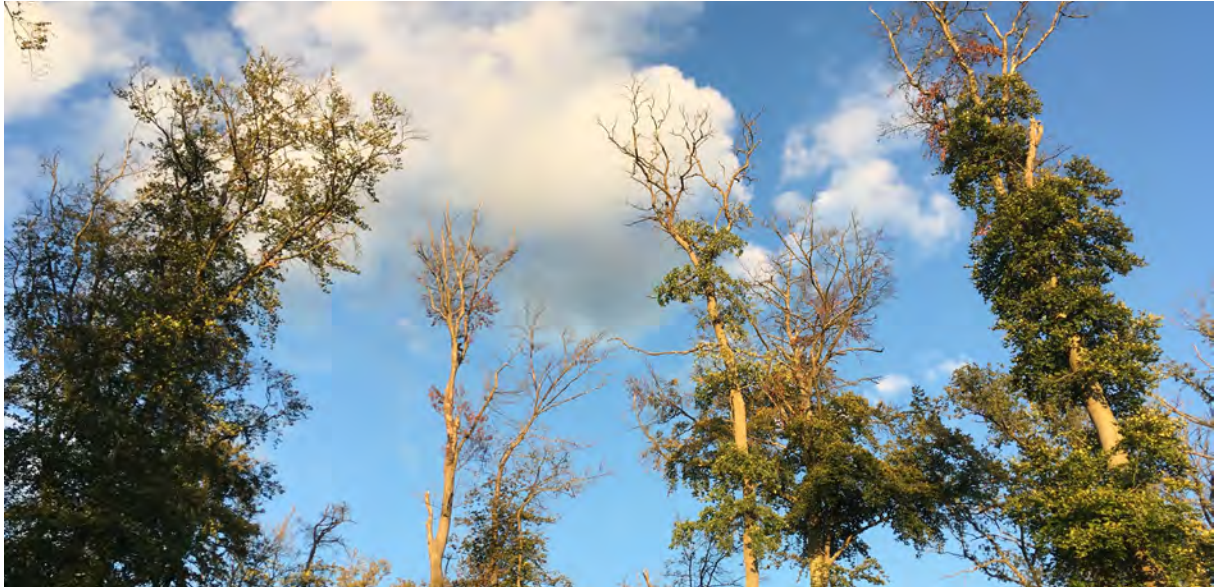
Dépérissement du hêtre

Sur ces bases, compte tenu de leur état actuel et compte tenu des scénarii de réchauffement climatique, plus d'un million d'hectares sont identifiés comme à fort risque de dépérissement dans les 10 prochaines années. En appliquant, par hypothèse, des taux d'intervention plausibles aux quatre types de propriété (domaniale, communale, privée sous PSG, autre privée) (voir annexe 3 ) la surface totale des peuplements à forte probabilité de dépérir d'ici 10 ans à un stade demandant une reconstitution est de 515 000 ha dans l'hypothèse 1 et de 407 000 ha dans l'hypothèse 2 7 .