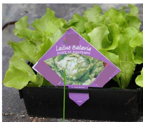
PP imprimé au dos

Exemples non exhaustifs d'apposition de Passeport Phytosanitaire :