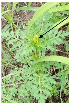
Épi floral sur jeune plant. Photo du 14/09. Gard.

Toutefois, on peut observer actuellement une très grande diversité de stades physiologiques : les ambrosies qui ont été fauchées ou mal désherbées sont retardées, et la grenaison pourra avoir lieu jusqu'à octobre. De même, dans les secteurs qui ont reçu les pluies de fin août, des germinations d'ambrosies ont eu lieu. Les plantes ont alors un cycle très court, comme le montre la photo, et seront capables de produire quelques graines qui leur permettront d'assurer leur survie.