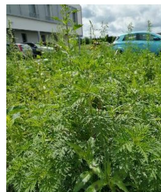
L'ambroisie découverte dans le parterre de l'EHPAD

Pour finir, face au constat que la gestion et l'entretien des espaces verts de l'EHPAD ne sont pas directement assurés par leurs soins, mais qu'il s'agit d'une prestation commandée auprès d'un Etablissement ou Service d'Aide par le Travail (ESAT), le CPIE a proposé à l'ARS qu'une formation spécifique à destination de ces structures soit mise en place afin de les sensibiliser à la problématique de l'Ambroisie et aux modes de gestion appropriés à sa présence.