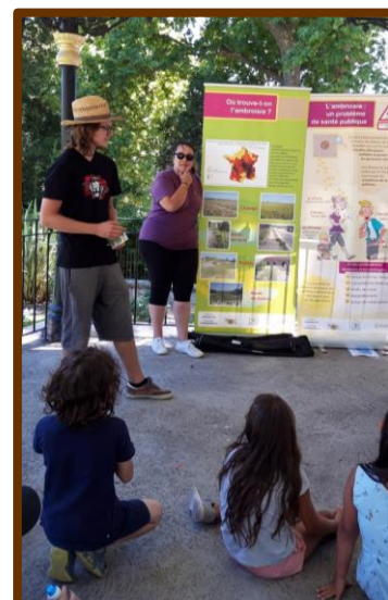
Présentation, jeu et sortie terrain pour les enfants. Merci pour leur accueil à l'équipe enseignante et à la mairie d'Anduze.