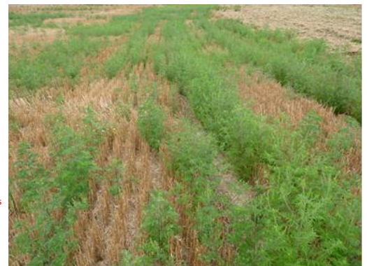
Levée d'ambrosies derrière un chaume. Il est temps ici de détruire l'interculture, avant fleurissement de l'ambrosie.