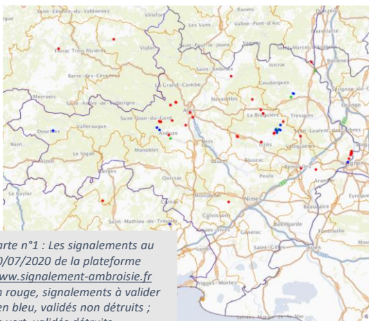
Carte n°1 : Les signalements au 30/07/2020 de la plateforme www.signalement-ambrosie.fr en rouge, signalements à valider ; en bleu, validés non détruits ; en vert, validés détruits