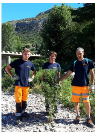
L'équipe verte d'Anduze avec le « trophée » de la journée, l'ambrosie la plus volumineuse arrachée.