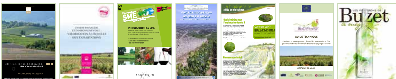
▲ Saint Émilion-Limouxin-Bourgogne-Costières de Nîmes