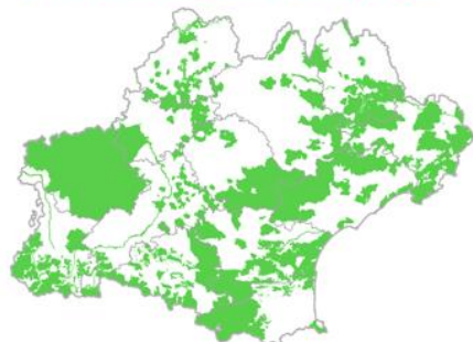
ENJEU 2 - BIODIVERSITE REMARQUABLE