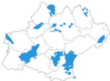
ENJEU 1 - EAU