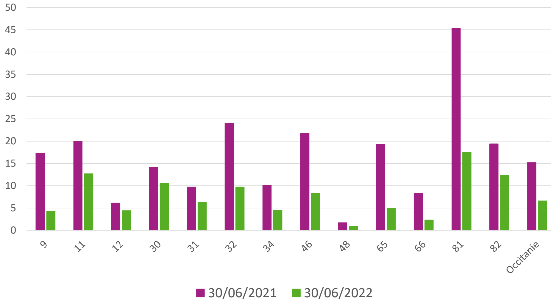
% de veaux de moins de 12 mois sans statut BVD

6,6% des veaux non dépistés entre 0 et 20j