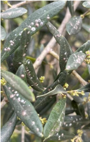
Cochenilles diaspines

Les cochenilles sont des insectes piqueurs-suceurs très polyphages (non spécifiques à une plante hôte) de la super famille des Coccoidea qui regroupe plusieurs familles.