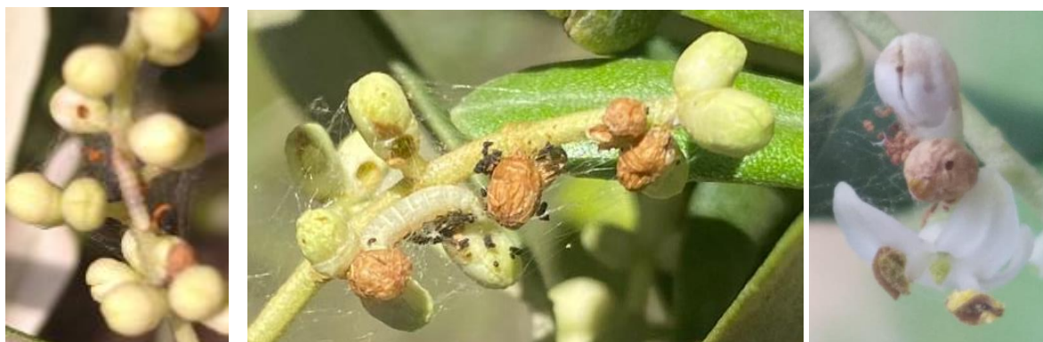
Dégâts et présence de teigne

En ce moment, vous pouvez observer des excréments, des larves et des dégâts sur vos inflorescences comme sur les photos ci-dessous. Sur la photo de gauche, une jeune larve de premier stade grignote des boutons floraux. Au centre, la larve est déjà plus âgée (et moins sensible au Bt). Sur la photo de gauche, des dégâts sur boutons floraux sont observés.