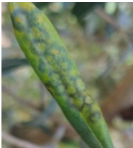
Taches d'œil de paon

Des nouvelles sorties de symptômes sont observées