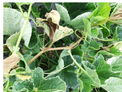
Bactériose sur tige