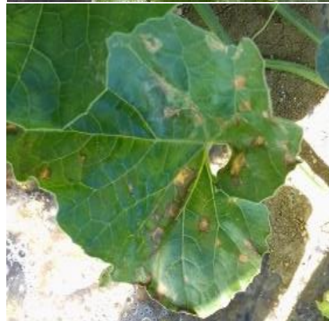
En haut : Cladosporiose – En bas: Bactériose sur feuilles