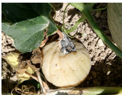
Sclérotinia sur fruit,

Suite aux conditions très humides, du sclérotinia peut s'observer sur des chenilles. Les fréquences restent faibles. Quelques fruits pourris à l'attache pistillaire.