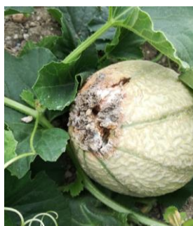
pourriture sur fruit, Photos : CA82