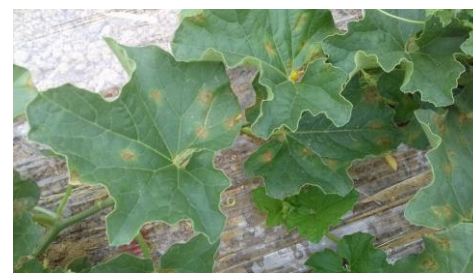
Symptômes de mildiou sur feuilles - Photo CA82

REPRODUCTION DU BULLETIN AUTORISÉE SEULEMENT DANS SON INTÉGRALITÉ (REPRODUCTION PARTIELLE INTERDITE)