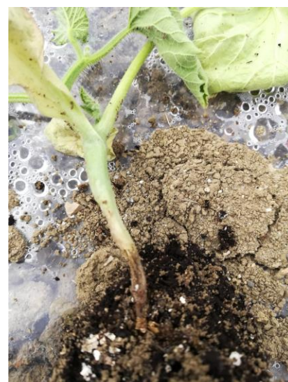
Etranglement au niveau du collet, sans présence de perforation de la tige, ni de larves.

Évaluation du risque : Le risque est faible lors des reprises de plants rapides.