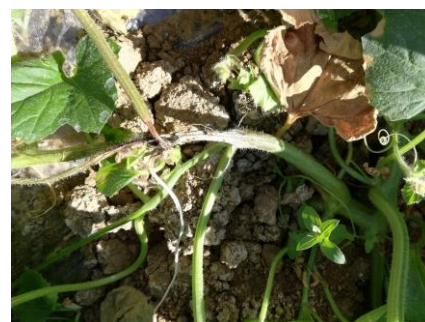
Sclérotinia sur tige

Semaine 24 : Des pluviométries très différentes sur la zone d'observation en début de semaine : de presque zéro dans l'est de la zone à plus de 60 mm dans le Gers et le Lot et Garonne.