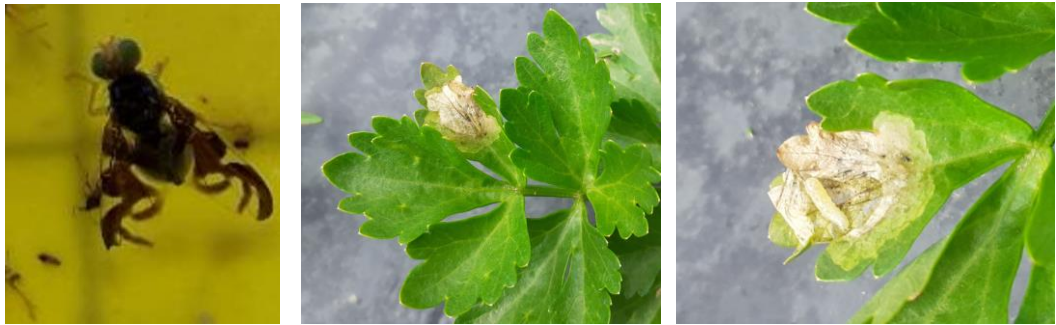
Mouche du céleri : adulte, dégât et larve

La corrélation entre les vols et les niveaux d'attaque observés ne sont pas systématiquement corrélés mais cela donne tout de même une indication.