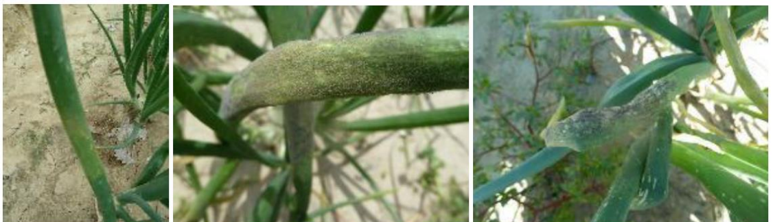
Mildiou : halo jaune, duvet gris violacé, dessèchement