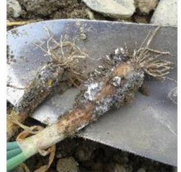
Pourriture blanche

son optimum thermique se situe sur une plage de température de 17 à 20°C. Il est favorisé par les périodes humides et pluvieuses et attaque les tissus ayant atteint un développement avancé.