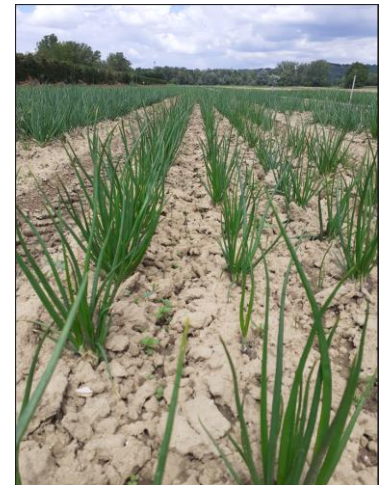
Plantation d'oignons

Sur parcelle flottante : mildiou généralisé sur une parcelle en région toulousaine (plantation d'automne).