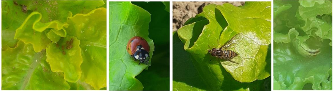
Pucerons sur feuille de chêne et auxiliaires : Coccinelle, Syrphe et larve de syrphe

Il n'est pas nécessaire d'intervenir tant que ce ravageur n'est pas présent sur vos cultures. Si vous détectez un pied avec des pucerons, observez plus attentivement les pieds alentours et la présence ou non d'auxiliaires.