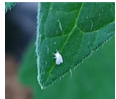
Aleurodes sur tomate

- Possibilité de mettre des panneaux englués jaunes pour suivre les vols