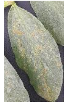
Rouille sur fève