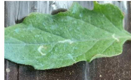
1 ère mines de Tuta