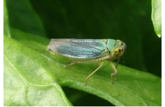
Cicadelle verte sur aubergine

Techniques alternatives : Possibilité de mettre des panneaux englués jaunes pour suivre les vols et faire un peu du piégeage.