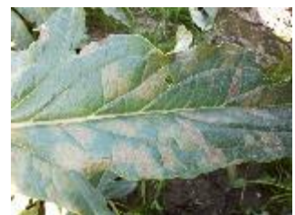
Mildiou sur artichaut

Sur les parcelles les plus exposées à l'humidité, nous observons quelques cas de mildiou peu virulent. Les attaques restent ponctuelles. Cependant, bien surveiller les parcelles car les brumes matinales et les influences maritimes peuvent favoriser l'apparition des symptômes.