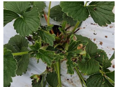
Dégâts noctuelle