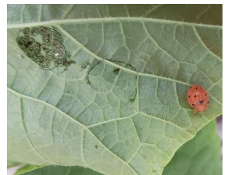
Pucerons sur concombre et coccinelle