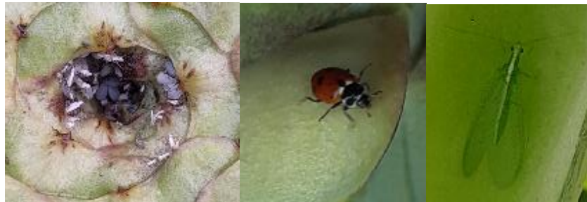
Pucerons cendrés, Coccinelle et chrysope adultes sur artichaut