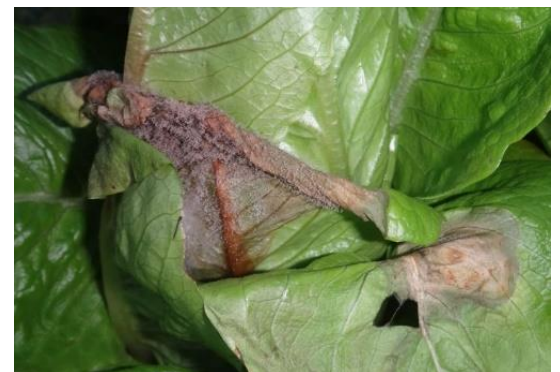
Botrytis sur salade

L'utilisation de moyens de bio-contrôle est possible et efficace. Consultez la liste des produits de bio-contrôle en cliquant ici et contactez votre technicien.