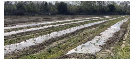
Récolte asperge verte

La présence d'œufs de criocères et de criocères adultes est observée sur certaines parcelles en récolte, ce qui en déprécie la qualité. Pour l'instant aucun traitement n'est réalisable.