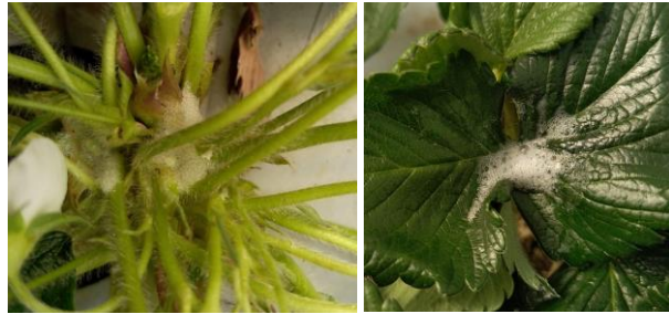
Cicadelle écumeuse – Photos CA30