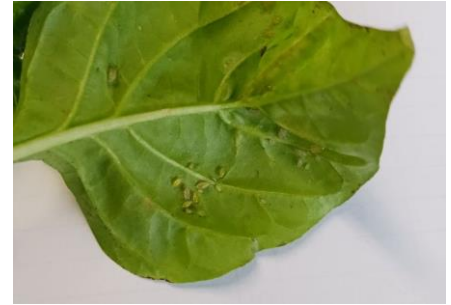
Pucerons sur piments

- Possibilité de faire des lâchers de parasitoïdes comme Aphidius colemani (vrac ou plantes relais), Aphidius ervi , Aphelinus abdominalis ou des prédateurs comme Aphidoletes aphidimyza