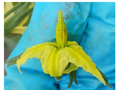
Marquage des fleurs par les bourdons

Évaluation du risque : Risque en augmentation