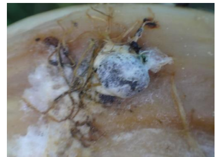
Sclérotinia sur fenouil