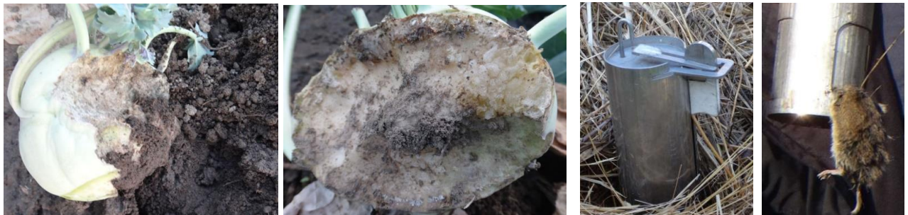
Dégâts de rats taupiers / campagnols – Piège mécanique

- Possibilité d'utiliser des pièges mécaniques à mettre dans les galeries