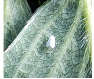
Trialeurodes sur fraisier – Photo CA30