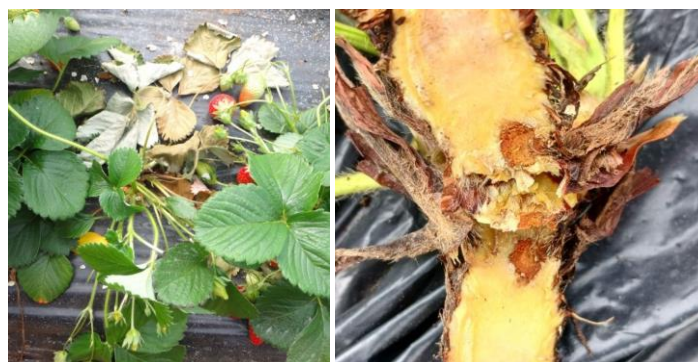
Symptômes Phytophthora

Techniques alternatives : L'utilisation de moyens de bio-contrôle est possible. Liste des produits de bio-contrôle . Contacter votre technicien.