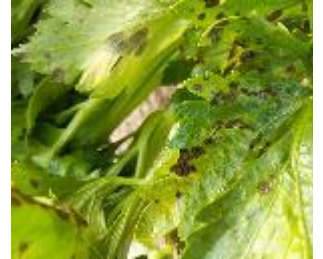
Septoriose sur céleri