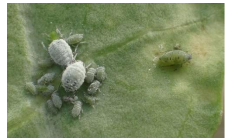
Pucerons cendrés sur chou rave