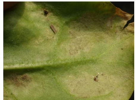
Mildiou sur épinard