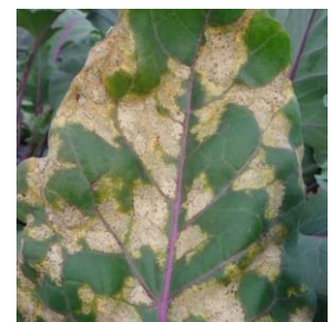
Mildiou sur chou rave