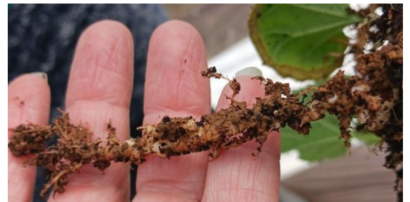
Nématodes sur melon