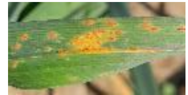
Rouille sur ail