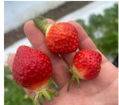
Dégâts de souris

Techniques alternatives : Possibilité de mettre des appâts autour de la culture.