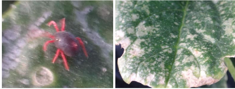
Penthaleus major et dégâts sur épinard