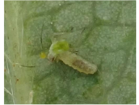
Larve de syrphe mangeant un puceron – Photo CA30