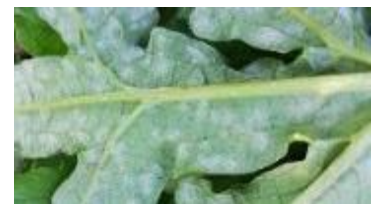
Oïdium sur artichaut

L'oïdium est en augmentation voir en forte augmentation sur tous les secteurs. Les pluies des dernières semaines et les fortes humidités matinales alternées avec des périodes venteuses ont favorisé la sortie des symptômes. Les symptômes peuvent aller de quelques taches éparées sur les parcelles les moins exposées à des attaques plus généralisées sur l'ensemble des plants sur les parcelles les plus sensibles.