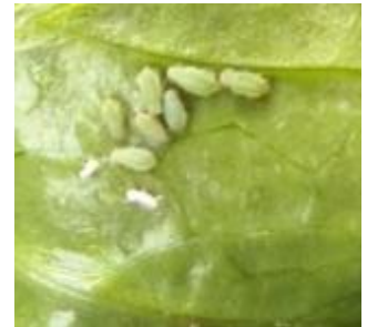
Pucerons sur céleri