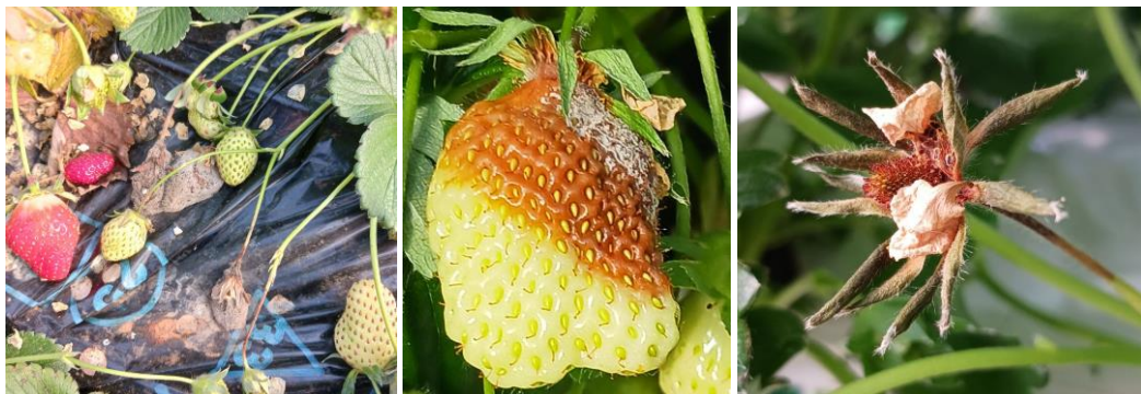
Botrytis sur fruits et fleurs - Photos JEEM et CA30