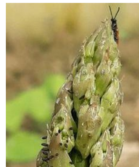
Criocères œufs et adulte