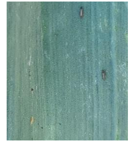
Thrips sur ail