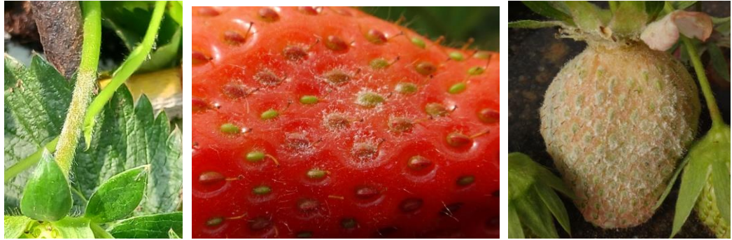
Oïdium sur pétiote et sur fruits