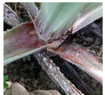
Sclerotinia sur artichaut Photo CA66