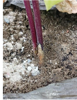
Dégâts de fourmis sur haricot

Liste des produits de bio-contrôle . Contacter votre technicien. Attention notamment pour la terre de diatomées, il faut qu'elle reste sèche pour avoir une certaine efficacité.