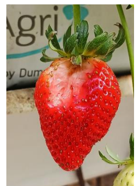
Dégâts oiseaux

Évaluation du risque : Risque en augmentation.