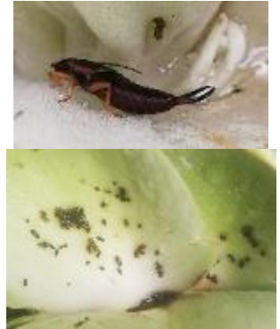
Forficule et déjections sur capitule

Évaluation du risque : Risque de salissures en augmentation