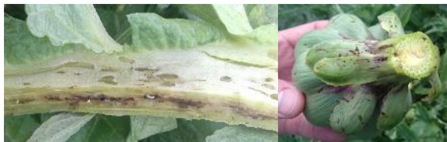
Larves et galeries d'apion sur capitule