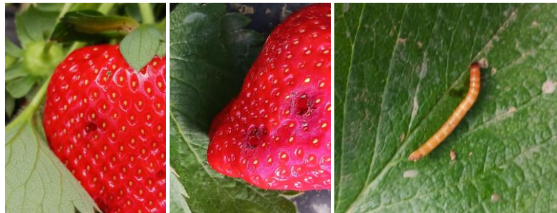
Taupin et dégâts