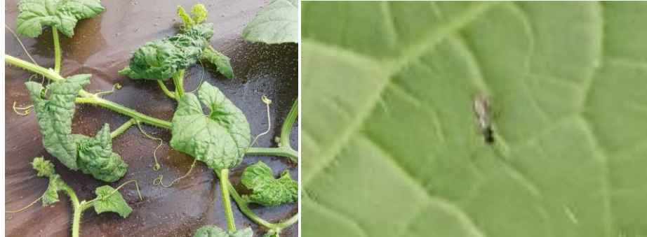
Pucerons sur melon et aphidius