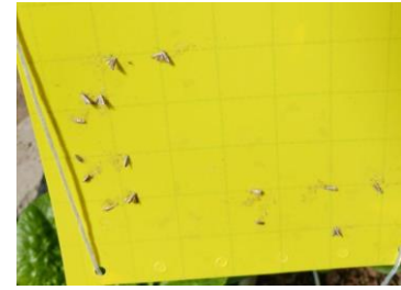
Piégeage Tuta

- Mettre en place la confusion sexuelle au moyen d'1 diffuseur de phéromone pour 10m 2 (1000 diffuseurs/ha, soit 690 € / ha) avec renforcement sur les bordures. Confusion à mettre en place avant ou le jour de la plantation de la culture. Les diffuseurs doivent être suspendus à 80-100 cm du sol et ne pas trop enrouler les diffuseurs autour d'un fil sinon la diffusion ne se fera pas bien. Durée d'application : 110-120 jours au printemps-été et 150-160 jours en automne-hiver.