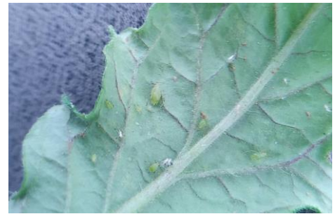
Pucerons - Photos CA30