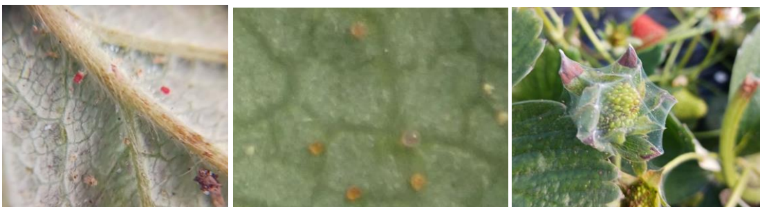
Formes mobiles et œufs sur fraisier - Présence de toile