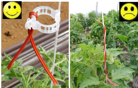
Mise en place de la confusion – Présence de Macrolophus