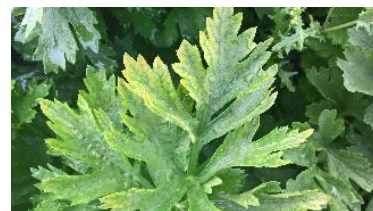
Carence Mg – Photo CA31

Carence en Bore : peut favoriser des « gerçures » des côtes