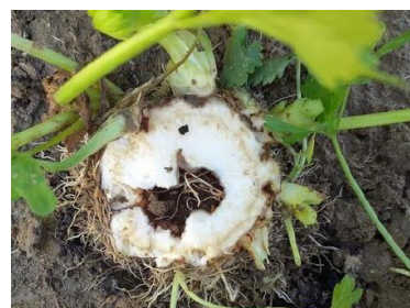
Cœur creux- Photo CA31

À la récolte, il est possible d'observer des pieds de céleri présentant un cœur creux et noir. Ce symptôme, non parasitaire, est lié à une mauvaise induction florale et une montaison qui a du mal à se produire. La dominance apicale est en partie inhibée et des bourgeons axillaires se développent. Des brûlures, consécutives à la rétention d'eau sur l'apex peuvent également conduire au développement du cœur creux. Dans certains cas, des microorganismes secondaires peuvent se développer et se multiplier, entraînant le brunissement superficiel des tissus.