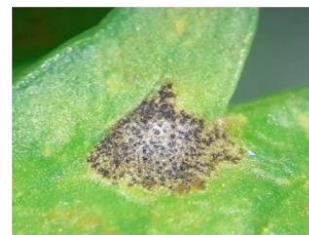
Septoriose - Photo CA31

Symptômes : La Septoriose du céleri est une maladie cryptogamique foliaire (c'est-à-dire due à un champignon microscopique). La maladie se manifeste tout d'abord par l'apparition sur le feuillage de petites taches brun clair, souvent délimitées par les fines nervures des feuilles mais parfois aux contours irréguliers de taille allant de 1 à 4 mm. Elles se colorent progressivement en brun-rougeâtre et comportent en leur centre, sur la face supérieure, des petits points noirs appelés pycnides (petites structures globuleuses qui assurent la multiplication asexuée du champignon). Ces taches vont se multiplier et se propager sur l'ensemble du feuillage.