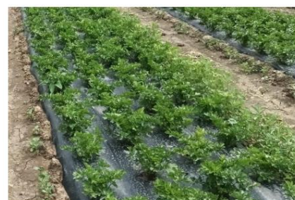
Céleri-branch sur paillage biodégradable en goutte à goutte

Il est à noter que les dégâts de septoriose sont moindres avec une conduite sur paillage en goutte à goutte et lorsque la culture est bien aérée (à ne pas placer entre deux bandes de cultures hautes).