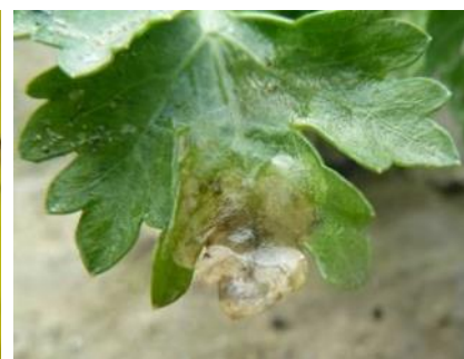
Mouche du céleri sur panneau jaune englué et dégât sur feuille de céleri

Prophylaxie : Il est possible de suivre facilement le vol à l'aide de panneaux jaunes englués changés hebdomadairement mais cela ne permet pas de l'anticiper pour la pose de filet par exemple.