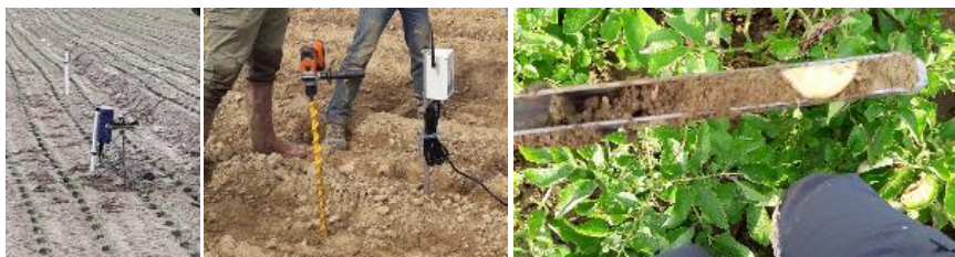
Sondes tensiométriques connectées, sonde capacitive connectée, humidité du sol sur 25 cm à l'aide d'une gouge