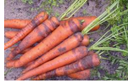
Maladie de la bague

Maladie de la bague ( Phytophthora megasperma ) : les premiers symptômes apparaissent à l'automne sous la forme d'un anneau translucide bien délimité autour de la racine. Par la suite il s'élargit en prenant une teinte brun-clair (jusqu'au noir) pour évoluer en pourriture humide pouvant gagner toute la racine. Cela favorise aussi l'invasion d'agents secondaires (notamment des bactéries). Cette pourriture se développe plutôt en janvier/février, on lui attribue souvent le nom de « pourriture hivernale de la carotte ».