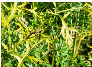
Alternariose - Photo CA 31

La maladie est favorisée par de fortes humidités et des températures élevées comprises entre 15 et 30°C avec un optimum à 25°C. Les spores sont propagées par le vent, l'eau de ruissellement et les éclaboussures. Les symptômes apparaissent 8 à 16 jours plus tard après une période contaminante, avec des températures > 18°C et une forte humidité.