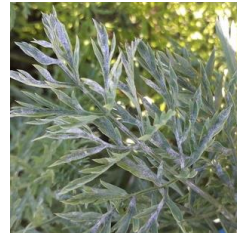
Oïdium - Photo CA 31

Biologie et conditions favorables à son développement : La maladie se développe à la faveur d'un temps chaud et sec en journée avec une humidité nocturne. Les sporulations apparaissent 7 à 14 jours après l'infection. Les formes de conservation sont mal connues.