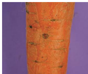
Cavity spot