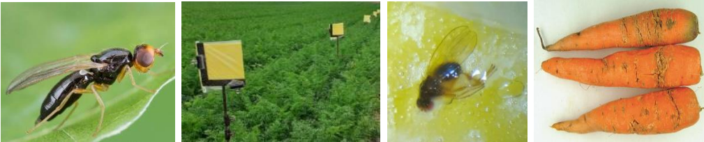
Mouche de la carotte (env.5 mm) - Réseau de piégeage et mouche sur piège enroulé - Dégâts de mouche

Biologie : La mouche est petite et difficile à identifier à l'œil nu : 4 à 5 mm de long, corps noir et brillant, pattes entièrement jaunes, ailes hyalines, plus longues que l'abdomen et yeux rouges.