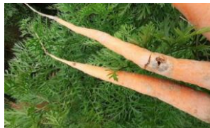
Dégâts de Taupin

La larve est très sensible à la sécheresse. Elle se déplace verticalement dans le sol selon l'humidité, la température du sol et la saison (elle monte en période humide et descend en période sèche). Elle creuse des galeries et attaque les parties enterrées des plantes.