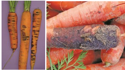
Rhizoctone brun, Rhizoctone violet

Biologie et conditions favorables à son développement : Les Rhizoctonia ont une persistance de vie très longue dans les sols. Ils peuvent parasiter de nombreuses cultures et adventices. Ils ont besoin d'une humidité importante pour se développer. Leur optimum de température se situe autour de 20°C.