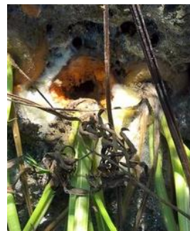
Sclérotinia – Photo CA31