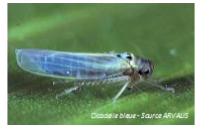
Cicadelle bleue

Seuil indicatif de risque : Atteint quand la feuille de l'épi porte des traces blanches et que les feuilles immédiatement inférieures sont desséchées.