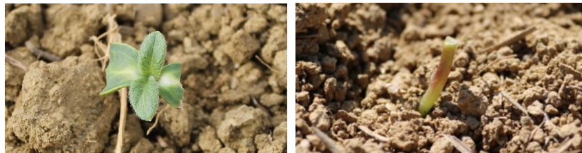
Dégâts d'oiseaux sur plantules de tournesol

La surveillance est à maintenir jusqu'à la première paire de feuille étalée.