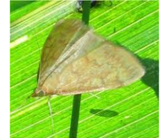
Papillon de pyrale

Des pontes ont pu être observées dans le sud de la Haute Garonne. Le modèle « Weibull » (au 12 juin) prévoit le pic de vol de première génération à partir du 13 juin pour les secteurs les plus précoces. Ci-dessous, les données par station météo :