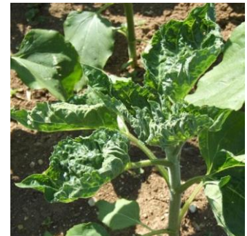
Feuilles crispées dues aux pucerons

En cas de doute sur l'origine des crispations, revenir vers votre technicien.