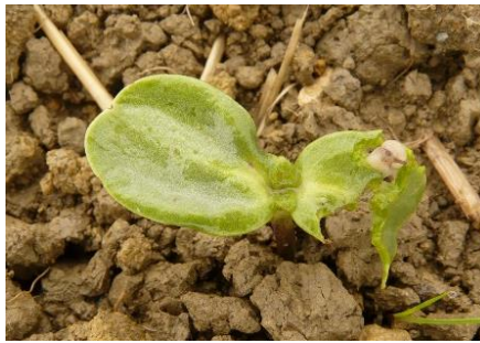
Dégâts de limace sur jeune pied de tournesol

Une grande partie des parcelles ont aujourd'hui dépassées le stade de sensibilité. Cependant, nombre de parcelles, issues des derniers semis restent encore exposées au risque. Les conditions humides récentes restent très favorables à l'activité des limaces. Le risque historique, ainsi que l'état de surface (résidus de couverts végétaux, mottes, fermeture du sillon) sont des éléments essentiels à prendre en compte pour évaluer le risque. La sensibilité du tournesol s'étend jusqu'à l'apparition de la deuxième paire de feuilles.