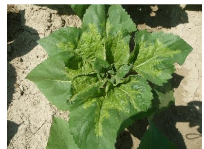
Symptômes de mildiou du tournesol : taches chlorotiques sur face supérieure des feuilles

Si vous rencontrez des situations avec un taux d'attaque significatif (>5 % de pieds touchés en moyenne sur la parcelle), sur des variétés annoncées RM8 ou RM9 contactez votre conseiller afin de déterminer l'attaque et éventuellement réaliser un prélèvement pour déterminer la race présente.