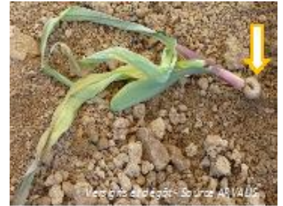
Dégâts de vers gris

Évaluation du risque : Surveillez les parcelles dès la levée et jusqu'à 10 feuilles, en particulier les bordures.