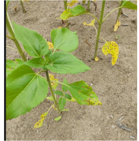
Symptômes de septoriose sur les premiers étage foliaire - Terres Inovia

Depuis plusieurs jours, des symptômes de septorioses sont relevés dans les parcelles. Généralement cantonnée aux premiers étages foliaires, la maladie est favorisée par les conditions humides au printemps. Bien qu'en deuxième partie de cycle les symptômes puissent progresser plus haut sur la plante, la nuisibilité est considérée comme négligeable, en l'état des connaissances actuelles.