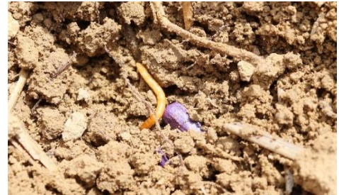
Présence de taupin à proximité d'une graine de tournesol

La protection réalisée dans la plupart des situations à risque (situations avec pression historique) permet un bon contrôle mais empêche de refléter la pression réelle.