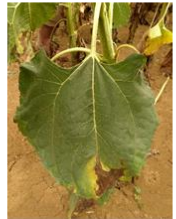
Phomopsis sur feuilles de tournesol

Les semis très précoces (<15/04), à densités élevées constituent les facteurs de risque aggravants, en particulier cette année. Rappelons aussi, que depuis plusieurs années, le phomopsis est devenu très discret sur le territoire.