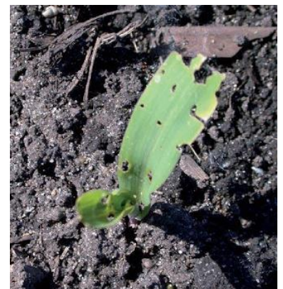
Dégâts de vers gris – Photo Arvalis

Évaluation du risque : Surveillez les parcelles dès la levée et jusqu'à 10 feuilles, en particulier les bordures. Le retour de températures plus clémentes est favorable à ce ravageur.