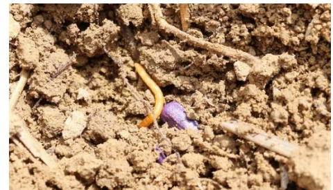
Présence de taupin à proximité d'une graine de tournesol

La protection réalisée dans la plupart des situations à risque (situations avec pression historique) permet un bon contrôle mais empêche de refléter la pression réelle.