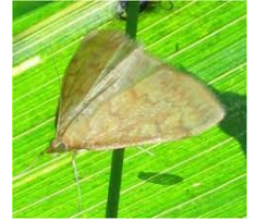
Papillon de pyrale

Le modèle « Weibull » (au 04 juin) prévoit le pic de vol de première génération à partir du 13 juin pour les secteurs les plus précoces. Ci-dessous, les données par station météo :