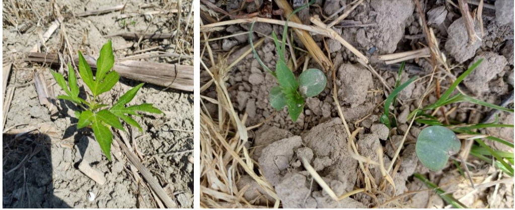
Germination d'Ambrosie trifide – St-Sernin Les Lavour (81) (13 mai 2024) stade cotylédons (avril 2024)

Evaluation du risque : les conditions sont très favorables aux levées et à la croissance des ambrosies.