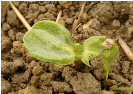
Dégâts de limace sur jeune pied de tournesol

La sensibilité du tournesol s'étend jusqu'à l'apparition de la deuxième paire de feuilles.