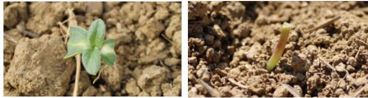
Dégâts d'oiseaux sur plantules de tournesol A gauche, les cotylédons sont touchés mais la plante pourra poursuivre son développement A droite, l'apex est sectionné par conséquent la plante est détruit