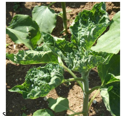
Feuilles crispées dues aux pucerons

En cas de doute sur l'origine des crispations, revenir vers votre technicien.