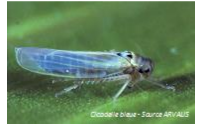
Cicadelle bleue

Seuil indicatif de risque : Atteint quand la feuille de l'épi porte des traces blanches et que les feuilles immédiatement inférieures sont desséchées.