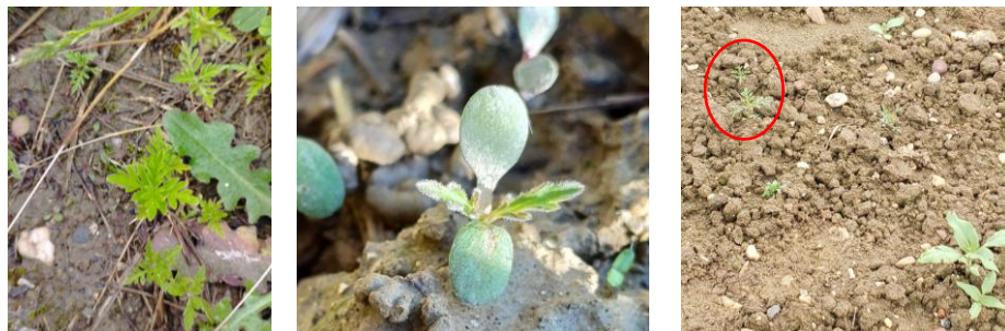
Plantules d'Ambrosie à feuille d'armoise, de gauche à droite : Lycée Agricole Capou (82) le 6 mai 2024, nord Gers le 14 avril 2024, commune de Giroussens (81) le 27.05.24

Ambrosie trifide : ses cotylédons sont elliptiques, charnus et de grande taille