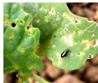
Petite altise sur colza.

Rapprochez-vous de votre conseiller pour en obtenir une.