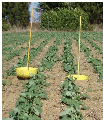
Cuvette jaune en situation.

La majorité des parcelles est toujours en phase sensible et la présence du ravageur est fréquemment observée.