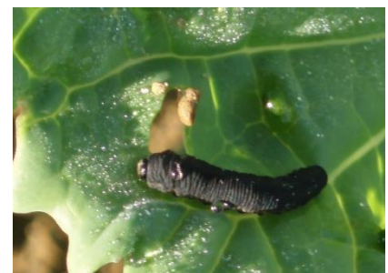
Larve de tenthrède de la rave sur colza.

Seuil indicatif de risque : 25 % de la surface foliaire détruite par les larves de tenthrèdes.