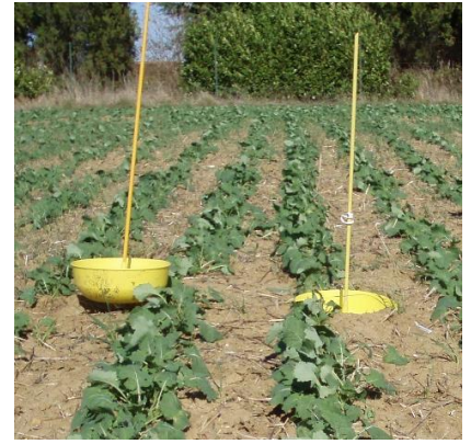
Cuvette jaune en situation. Rapprochez-vous de votre conseiller pour en obtenir une.

Une part importante des parcelles est toujours en phase sensible. Les signalements de petites altises restent présents, mais sont désormais amenés à diminuer.