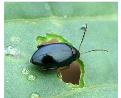
Grosse altise sur colza.

A ce jour, le risque est faible car l'arrivée de l'insecte sur les parcelles n'est pas effective. Selon la météo de la fin de la semaine, la situation pourrait être amenée à évoluer. La surveillance par le piégeage en cuvette d'une part, et l'observation des morsures d'autre part est à prévoir.