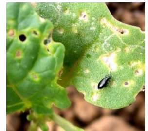
Petite altise sur colza.