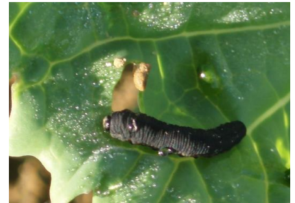
Larve de tenthrède de la rave sur colza (photos Terres Inovia).

A ce jour, aucun retour. Surveillez vos parcelles jusqu'au stade 6 feuilles. Les conditions peu poussantes aggravent le risque. Soyez vigilant et réactif en cas de pullulation.