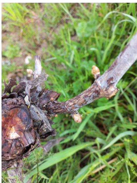
Excoarose : Symptômes sur bois - Photo CA81

Des symptômes d'excoarose sur bois d'un an sont régulièrement observés sur divers cépages tels que le Loin de l'œil, le Gamay, le Duras, le Mauzac et la Syrah.