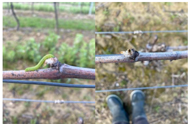
Chenille de noctuelle (à gauche) et bourgeon évidé (à droite)

A ce jour, il a été constaté environ 7 pieds attaqués (tous les bourgeons évidés) par des mange-bourgeons sur une parcelle de la plaine en bout de rang. Pas d'autres dégâts constatés à ce jour, pression non significatif à l'échelle du vignoble.