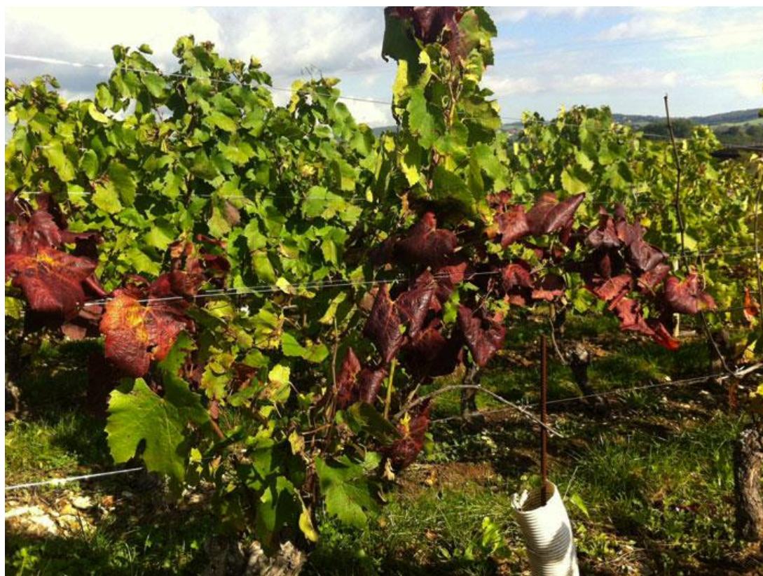
Symptômes de Flavescence