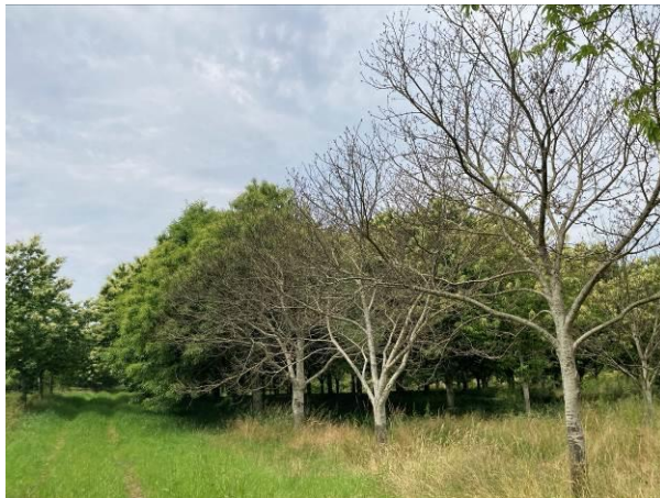
Verger d'une dizaine d'années, Bouchez de de Bétizac Haute-Vienne

L'automne et le printemps exceptionnellement pluvieux ont inondé certaines zones de parcelles dans lesquelles les racines des arbres ont « baigné » durant une longue période. Il en résulte le dépérissement des arbres, parfois des arbres en pleine production qui ne montraient pas de signes de faiblesse particuliers.