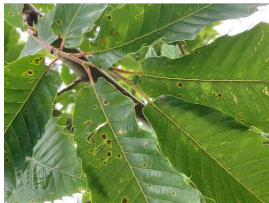
Début de contamination sur Bournette