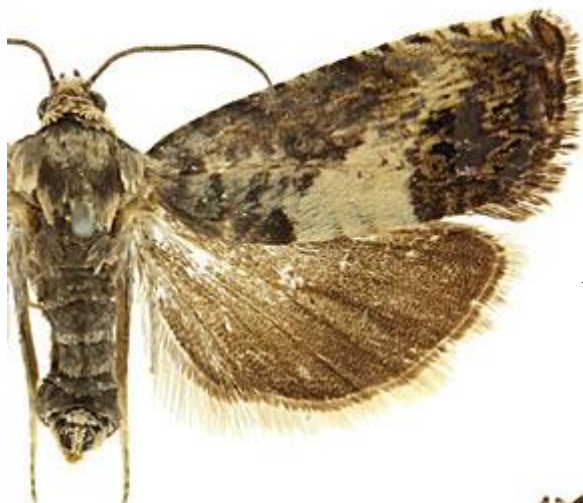
← Adulte mâle de Pammene fasciana (tordeuse)

Le mâle adulte, piégé par les phéromones, ressemble au mâle du carpocapse. Néanmoins, les différences de dates de vol et la spécificité des phéromones utilisées doivent permettre la distinction.