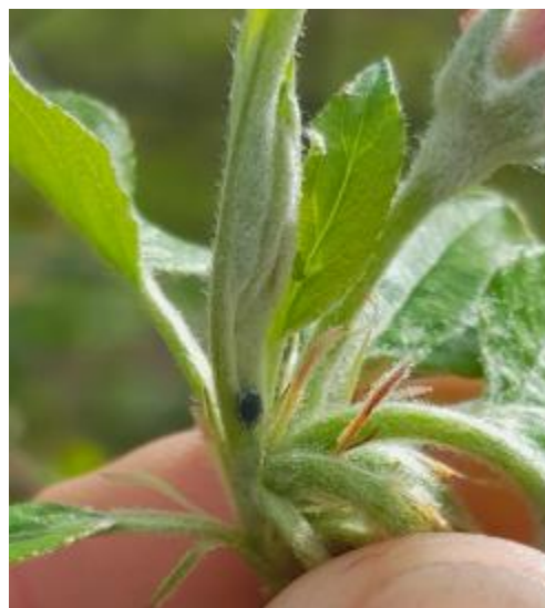
Fondatrice de puceron cendré