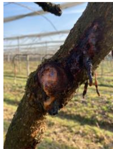
Écoulement de PSA sur kiwis jaunes

Mesures prophylactiques : Parcourir les parcelles pour bien observer les arbres et déceler les symptômes. Sur Hayward, éliminer et remplacer les plants mâles malades. Éliminer les cannes de renouvellement très touchées (présence d'écoulements) mais ne pas toucher aux charpentières ni au tronc.