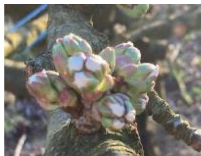
Cerisier, variété Folfer, Stade tout début D