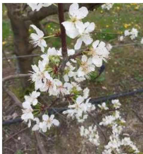
Prunier domestique variété Reine-Claude – Stade F Photo Chambre d'Agriculture 82 2024

Pruniers domestiques (Reine-Claude, Bavay, Président, Diaphane) : stade F (pleine floraison) à G.