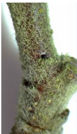
Œufs de puceron cendré (x3)