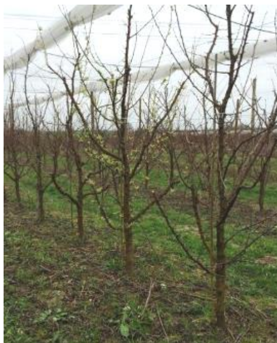
Arbre malade à feuillaison précoce – Photo CA82

Techniques alternatives : L'application de barrières physique (argile, Hydroxyde de Calcium...) présente un intérêt en complément de l'arrachage des arbres malades. Elle est à réaliser avant le début du vol du psylle.