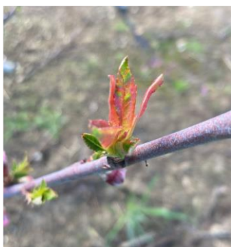
Cloque sur pêcher précoce

Le stade sensible pour les contaminations de cloque est le stade pointe verte, lorsque les bourgeons à bois s'entrouvrent et permettent la pénétration des spores transportées par l'eau. D'autre part, une fois le stade sensible atteint, les contaminations ne sont possibles qu'en cas de pluies et de températures supérieures à 7°C.