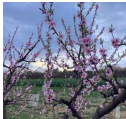
Pêcher, variété Garaco Stade F Photo Philippe PRIEUR, 2025