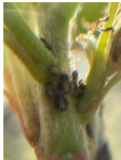
Larves âgées de psylles

Mesures prophylactiques et/ou techniques alternatives : Des applications d'argile ou de BNA dès le début et pendant toute la durée de la période de ponte ont un effet de barrière physique intéressant et permettent de réduire très significativement les niveaux de populations au printemps.