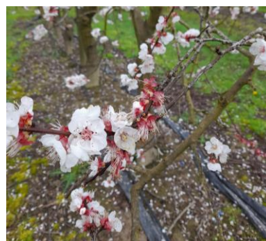
Abricotiers Japonaises variété Wondercot Stade début G Photo Anne PENAVAYRE 2024