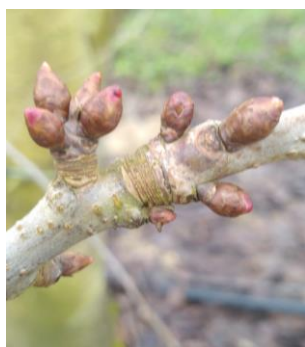
Cerisier, variété Folfer, Stade B Photo Diego NOVOA 2024