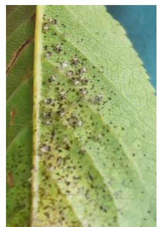
Tigre du poirier sur feuille

Sur notre réseau de parcelles, nous observons quelques développements importants sur des parcelles en AB principalement.