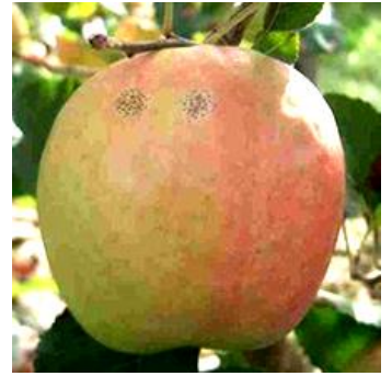
Maladie des « crottes de mouche »

Évaluation du risque : A surveiller, notamment en AB ; risque fort si périodes pluvieuses.