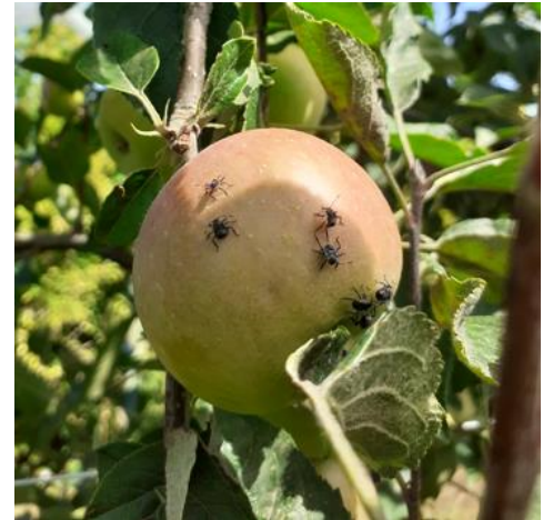
Jeunes larves (L2) de punaise diabolique sur fruit

Évaluation du risque : Risque localisé. A surveiller à la parcelle.