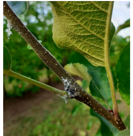
Foyer de pucerons lanigères parasités par Aphélinus Mali