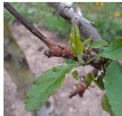
Chancre à nectria - Photo CA82

Mesures prophylactiques et / ou techniques alternatives : Nettoyer les chancres sur les arbres contaminés. Supprimer les branches trop contaminées lors de la taille. La prophylaxie est incontournable dans la gestion du chancre.