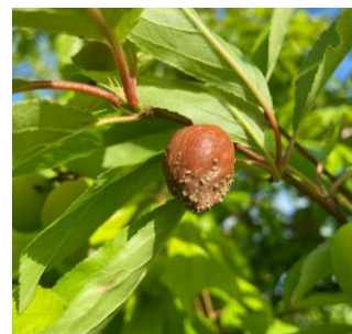
Symptômes de monilia sur prunier américano-japonais

Des symptômes sur fruits en pruniers américano-japonais ont été observés. La maladie ne semble pas progresser pour le moment excepté sur quelques secteurs bien spécifiques où des dégâts plus importants ont eu lieu.