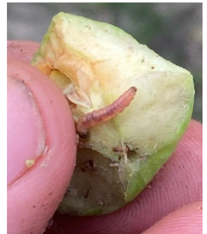
Larve de tordeuse orientale

Depuis quelques années, nous observons également la présence de punaises « estivales », comme la punaise diabolique (et également la punaise verte), qui provoquent des dégâts plus tard en saison, jusqu'à la récolte. Ces dégâts estivaux ressemblent à du bitter pit, avec présence de cellules liégeuses sous l'épiderme.