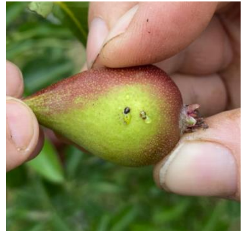
Larves âgées de psylles

Mesures prophylactiques et/ou techniques alternatives : Des applications d'argile dès le début et pendant toute la durée de la période de ponte ont un effet de barrière physique intéressant et permettent de réduire très significativement les niveaux de populations au printemps.