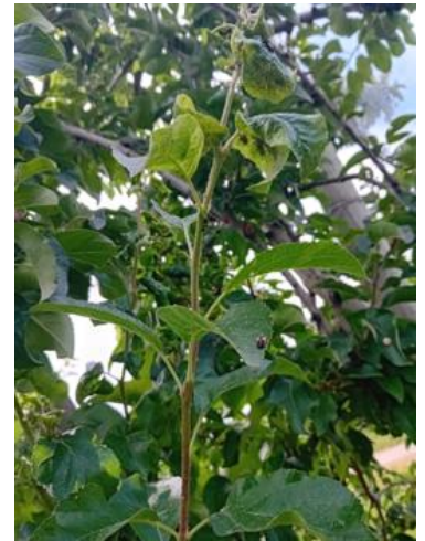
Foyer de pucerons cendrés et nombreuses larves de coccinelles