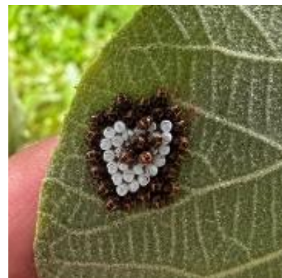
Jeunes larves (L1) de punaise diabolique sur Kiwi

Évaluation du risque : Risque localisé. A surveiller à la parcelle.