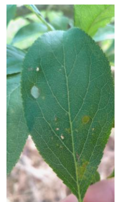
Symptôme de Rouille sur prunier américano-japonais

Évaluation du risque : Risque moyen à fort en cours. La période de risque est en cours. Des contaminations peuvent survenir en cas de précipitations, ce qui est annoncé par la météo au cours de la semaine. La pression s'annonce forte cette année au vu des conditions météos des semaines précédentes.