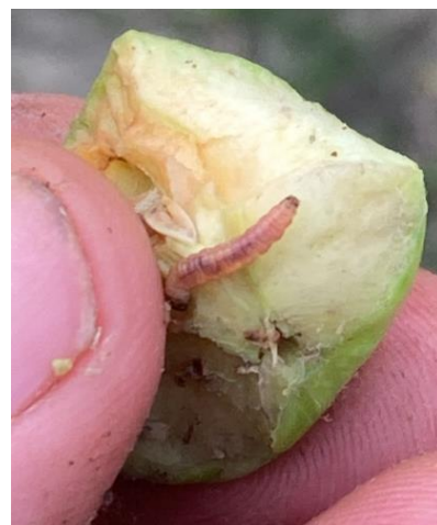
Larve de tordeuse orientale

Le modèle a été paramétré en début d'année (comme les années passées) avec un seuil de développement de la tordeuse en base 9°C. Les indications fournies par les pièges pour le début du second vol semblent en décalage (en retard) par rapport à celles fournies par le modèle. C'est pourquoi il nous semble plus pertinent de modifier ce paramétrage pour le mettre en base 10°C. Cette semaine, vous trouverez les informations avec les deux paramétrages, et à partir de la semaine prochaine les données indiquées seront issues du modèle en base 10.