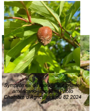
Symptômes de monilia sur prunier américano-japonais, Photo Chambre d'Agriculture du 82 2024

Évaluation du risque : Risque moyen à fort en cerisier, en variétés précoces d'abricotier, de pêche-nectarine et de pruniers japonais dont la récolte interviendra dans les 2 à 3 semaines. Les conditions météo sont favorables au monilia au vu de la montée des températures, de l'humidité et des précipitations prévues. Enfin, des éclatements sont observés sur plusieurs espèces. Ces éclatements sont autant de portes d'entrée pour ces champignons.