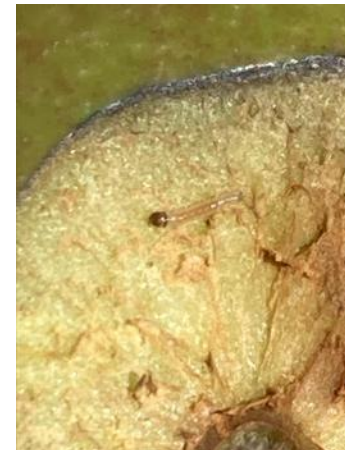
Larve de carpocapse

Évaluation du risque : pic d'éclosion de la G1 en cours