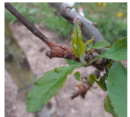
Chancre à nectria - Photo CA82

Évaluation du risque : Diminution du risque (risque en vergers contaminés, en cas de pluie).