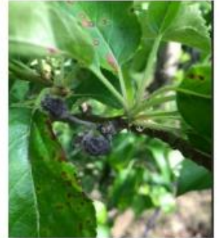
Black rot sur feuilles et momies

Évaluation du risque : Diminution du risque. Les périodes de pluie avec des températures douces sont favorables aux contaminations. Le risque est très lié à la parcelle.