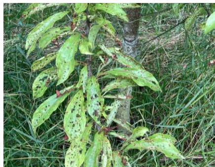
Criblures sur Prunier américano-japonais stade