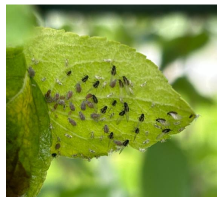
Foyer de pucerons cendrés et individus ailés

Nous observons également assez facilement des larves de syrphes, des forficules et des pontes de coccinelles.