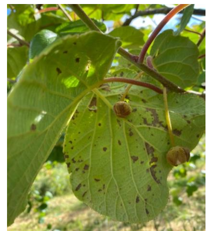
PSA sur feuille et fleur en kiwi vert

Nous avons observé des écoulements de PSA dans d'assez nombreuses parcelles. Par contre, nous ne voyons pour l'instant qu'assez peu de symptômes sur fleurs et feuilles.