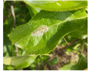
Dégâts de mineuses marbrées

Évaluation du risque : 2 ème vol en cours, risque faible.