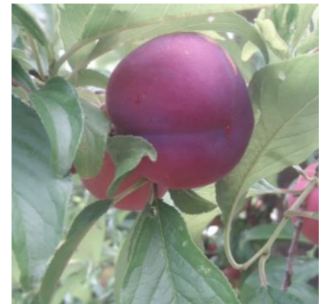
Prunier américano-japonais variété African Rose stade véraison, Photo Jean Jacques LANTOURNE 2024

Dans de nombreux secteurs, des criblures sont observées avec parfois une forte intensité de symptômes sur parcelle.