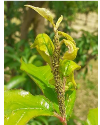
Pucerons verts sur prunier américano-japonais, Photo Chambre d'Agriculture 82, 2024

Évaluation du risque : Risque faible en cours. Avec le faible nombre de foyer observé et les formes ailées, nous pouvons estimer que le risque est faible voir terminé.