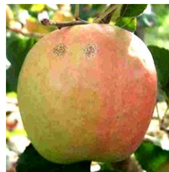
Maladie des « crottes de mouche » Photo CA82

Évaluation du risque : A surveiller, notamment en AB ; risque fort si périodes pluvieuses.