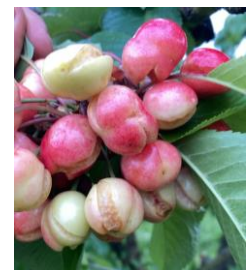
Eclatement sur cerise en début de saison

L'attractivité des fruits démarre à la véraison et s'accroît au fur et à mesure de la maturation. Les quelques pontes qui pourraient se produire sur fruits avant véraison avortent de façon quasi systématique.