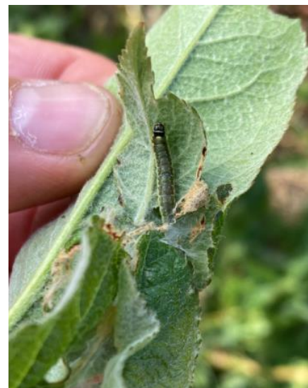
Dégâts et larve de capua sur pousse : feuilles collées entre elles avec tissage blanc

Mesures prophylactiques : la lutte par confusion sexuelle permet de limiter les populations et de diminuer l'usage des insecticides tout en améliorant l'efficacité de la protection. Les diffuseurs doivent être mis en place avant le début du vol (fin avril).