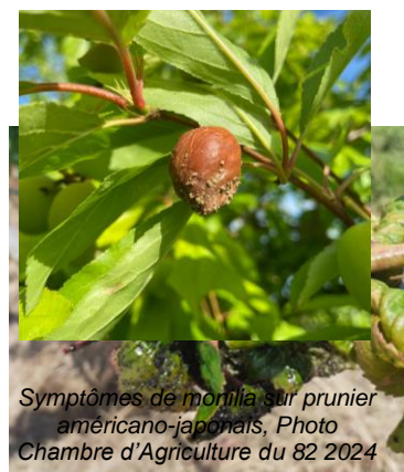
Symptômes de monilia sur prunier américano-japonais

Évaluation du risque : Risque moyen en cerisier, en variétés précoces d'abricotier, de pêche-nectarine et de pruniers japonais dont la récolte interviendra dans les 2 à 3 semaines. Les conditions météo sont moyennement favorables au monilia. Des précipitations sont prévues ce qui pourrait favoriser la maladie. Enfin, des éclatements sont observés sur plusieurs espèces. Ces éclatements sont autant de portes d'entrée pour ces champignons.