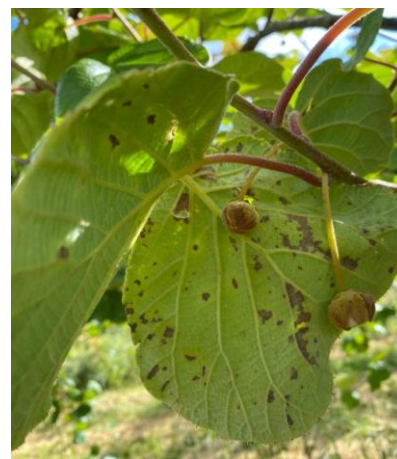
PSA sur feuille et fleur en kiwi vert

Nous avons observé des écoulements de PSA dans d'assez nombreuses parcelles. Par contre, nous ne voyons pour l'instant qu'assez peu de symptômes sur fleurs et feuilles.