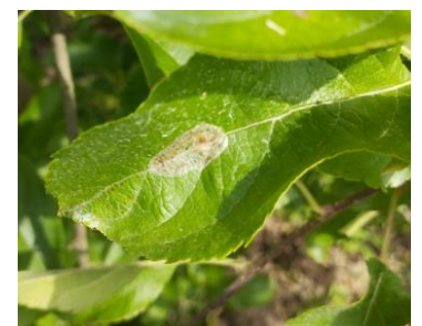
Dégâts de mineuses marbrées

Évaluation du risque : 2 ème vol en cours, risque faible.