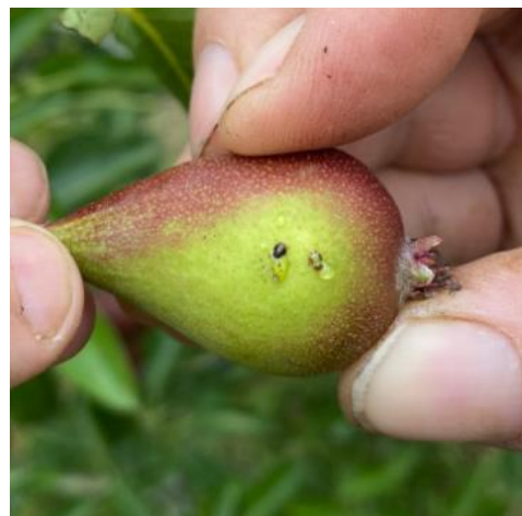
Larves âgées de psylles

Mesures prophylactiques et/ou techniques alternatives : Des applications d'argile dès le début et pendant toute la durée de la période de ponte ont un effet de barrière physique intéressant et permettent de réduire très significativement les niveaux de populations au printemps.