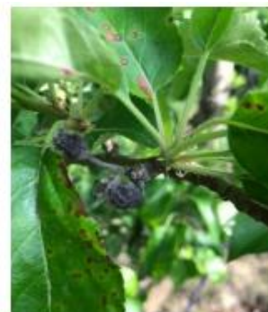
Black rot sur feuilles et momies

Évaluation du risque : Les périodes de pluie avec des températures douces sont favorables aux contaminations. Le risque est très lié à la parcelle.