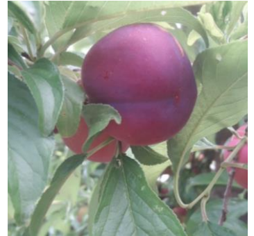
Prunier américano-japonais variété African Rose stade véraison

Dans de nombreux secteurs, des criblures sont observées avec parfois une forte intensité de symptômes sur parcelle.