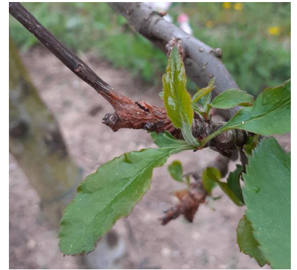
Chancre à nectria

: Nettoyer les chancres sur les arbres contaminés. Supprimer les branches trop contaminées lors de la taille. La prophylaxie est incontournable dans la gestion du chancre.