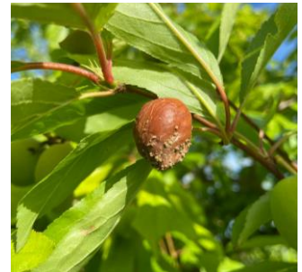
Symptômes de monilia sur prunier américano-japonais

Des symptômes sur fruits en pruniers américano-japonais ont été observés ainsi que des symptômes sur cerises éclatées. La maladie ne semble pas progresser pour le moment.