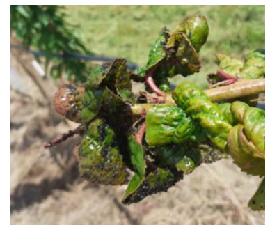
Foyer de puceron noir du cerisier

Des forficules sont régulièrement observés depuis le début de la saison dans les foyers de pucerons (en tant qu'auxiliaire). Cependant, il peut devenir un ravageur avec l'avancée de la saison et le mûrissement des fruits. Quelques rares dégâts ont été observés cette semaine sur cerises.