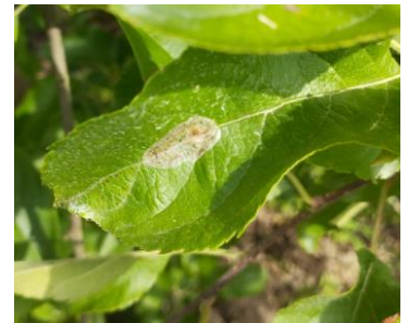
Dégâts de mineuses marbrées