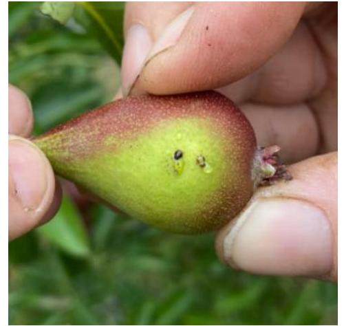
Larves âgées de psylles

Mesures prophylactiques et/ou techniques alternatives : Des applications d'argile dès le début et pendant toute la durée de la période de ponte ont un effet de barrière physique intéressant et permettent de réduire très significativement les niveaux de populations au printemps.