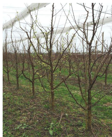
Arbre malade à feuillaison précoce

Mesures prophylactiques : Il convient de repérer et éliminer (arracher et brûler) au plus vite les arbres qui présentent un débournement anormalement précoce (feuillaison avant la floraison) et qui serviront de réservoir de phytoplasme.