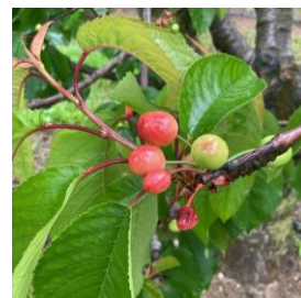
Véraison sur cerisier précoce

Sur les variétés les plus précoces, la véraison a débuté (Folfer, Primulat, Belize).