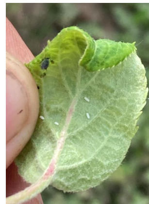
Foyer de pucerons cendrés et œufs de syrphes

durée d'humectation de la végétation (en h) x T° (en °C) > 130