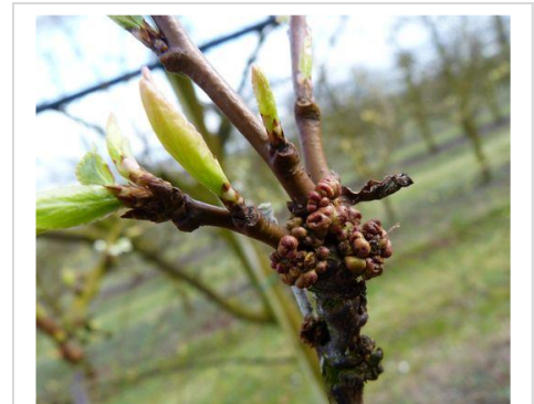
Galles de phytoptes sur September Yummy Photo CA82 (mars 2017)

La présence de phytoptes à galles (acariens) se repère par l'apparition à la base des bourgeons, de galles rondes, brunâtres, de 2mm de diamètre environ. Celles-ci sont provoquées par une réaction du végétal à l'effet des piqûres des acariens. A l'intérieur des galles, les tissus ont une couleur lie de vin. Les femelles qui hivernent dans ces galles migrent au printemps sur d'autres bases de bourgeons plus jeunes pour les parasiter. Sur les arbres atteints, on observe des bouquets de mai et des dards mal formés, des pousses à entre-nœuds courts, mal aoûtées. En cas de fortes attaques, la présence des phytoptes induit des défauts de floraison importants voire une absence de bourgeons à fleurs dans certaines situations (source : La Prune d'Ente , D. Carlot, 2004).