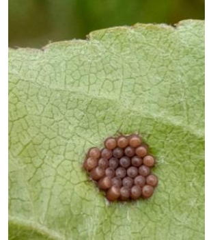
Ooplaque de punaise (pas d'indification précise de l'espèce, mais il ne s'agit ni de la punaise diabolique, ni de punaises vertes)

Nous observons les premières pontes de punaises depuis 2 semaines, mais pas de nouvelles pontes signalées cette semaine.