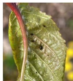
Petit foyer de puceron noir du cerisier

Évaluation du risque : Risque moyen. La période de risque a débuté avec l'éclosion des fondatrices et les premiers foyers. A surveiller attentivement car les foyers de ce puceron peuvent se développer rapidement.