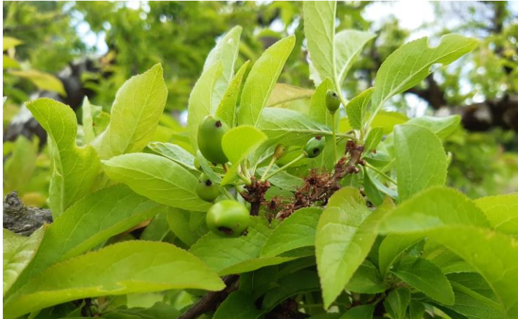
Dégâts d'hoplocampe sur Prunier américano-japonais – Photo J-F PLANAVERGNE 82 2024