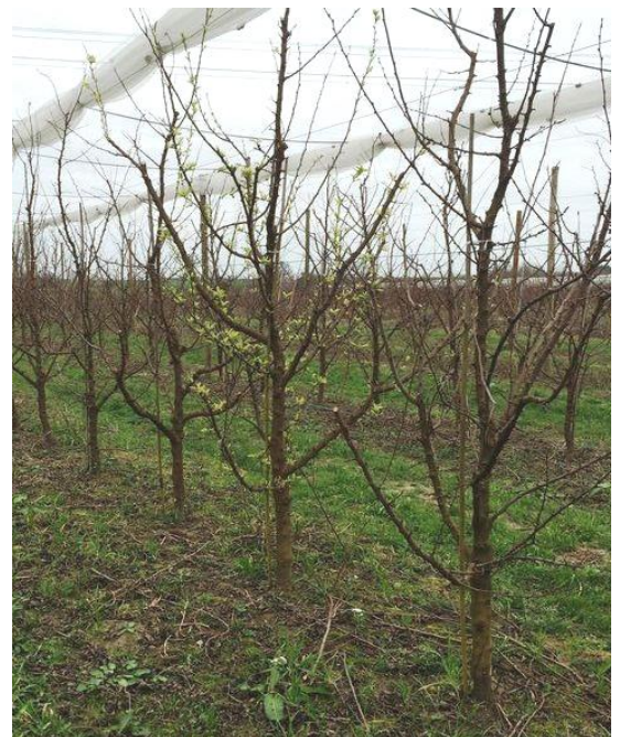
Arbre malade à feuillaison précoce

Évaluation du risque : Risque potentiellement en cours pour la dernière partie du vol. Deux individus ont été capturés cette semaine.