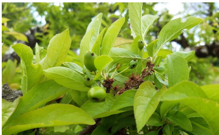
Dégâts d'hoplocampe sur Prunier américano-japonais – Photo J-F PLANAVERGNE 82 2024

La pulvérisation de nématodes parasitoïdes est une méthode alternative permettant de limiter les populations de larves au sol. Les nématodes sont à positionner au moment de l'enfouissement des larves autour de fin Avril/début Mai.