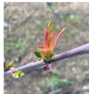
Cloque sur pêcher précoce – Photo Philippe Prieur 2024

Évaluation du risque : Fin du risque sur l'ensemble des variétés car le stade « premières feuilles étalées » est atteint partout.