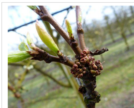
Galles de phytoptes sur September Yummy Photo CA82 (mars 2017)

La présence de phytoptes à galles (acaréens) se repère par l'apparition à la base des bourgeons, de galles rondes, brunâtres, de 2mm de diamètre environ. Celles-ci sont provoquées par une réaction du végétal à l'effet des piqûres des acaréens. A l'intérieur des galles, les tissus ont une couleur lie de vin. Les femelles qui hivernent dans ces galles migrent au printemps sur d'autres bases de bourgeons plus jeunes pour les parasiter. Sur les arbres atteints, on observe des bouquets de mai et des dards mal formés, des pousses à entre-nœuds courts, mal aoûtées. En cas de fortes attaques, la présence des phytoptes induit des défauts de floraison importants voire une absence de bourgeons à fleurs dans certaines situations (source : La Prune d'Ente , D. Carlot, 2004).