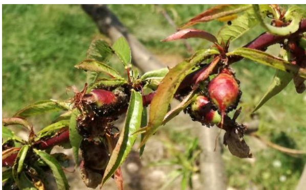
Puceron noir sur pêcher

Évaluation du risque : Risque en cours. A surveiller attentivement.