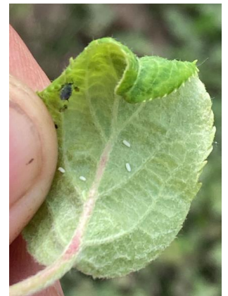
Foyer de pucerons cendrés et œufs de syrphes