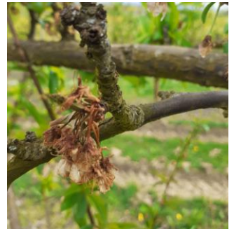
Monilia Fleur sur Prunier américano-japonais

Quelques symptômes ont été observés. Sur parcelles avec une protection plutôt légère, des symptômes plus importants sont observés tout en restant modérés.