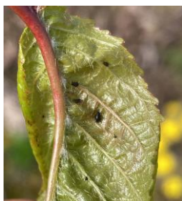
Petit foyer de puceron noir du cerisier

Évaluation du risque : Risque moyen. La période de risque a débuté avec l'éclosion des fondatrices et les premiers foyers. À surveiller attentivement car les foyers de ce puceron peuvent se développer rapidement.