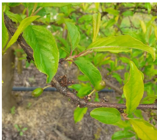
Prunier américano-japonais variété African Rose – Stade I

Essentiel des variétés : petits fruits (I) et grossissement du fruit