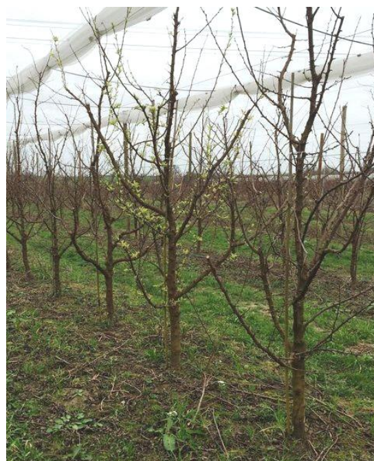
Arbre malade à feuillaison précoce – Photo CA82

Techniques alternatives : L'application d'argile ou de BNA pro en barrière physique présente un intérêt en complément de l'arrachage des arbres malades. Elle est à réaliser avant le début du vol du psylle.