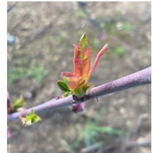
Cloque sur pêcher précoce – Photo Philippe Prieur 2024

Évaluation du risque : Fin du risque sur l'ensemble des variétés car le stade « premières feuilles étalées » est atteint partout.