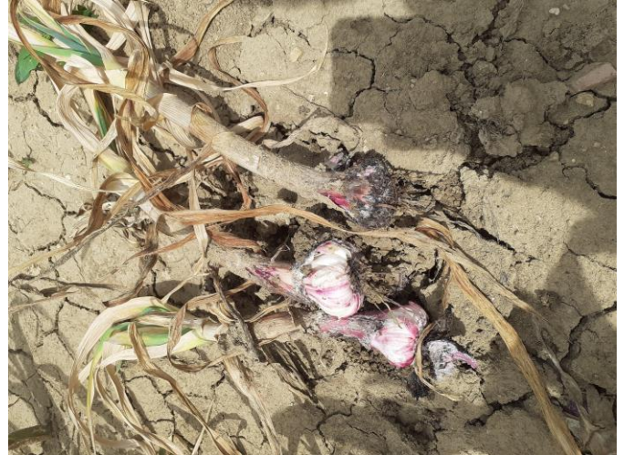
Pourriture blanche

En cas de formation de « ronds », veiller également dès à présent à limiter les déplacements de terre depuis les zones contaminées pour ne pas propager les sclérotés lors des passages de machines (travail du sol notamment).