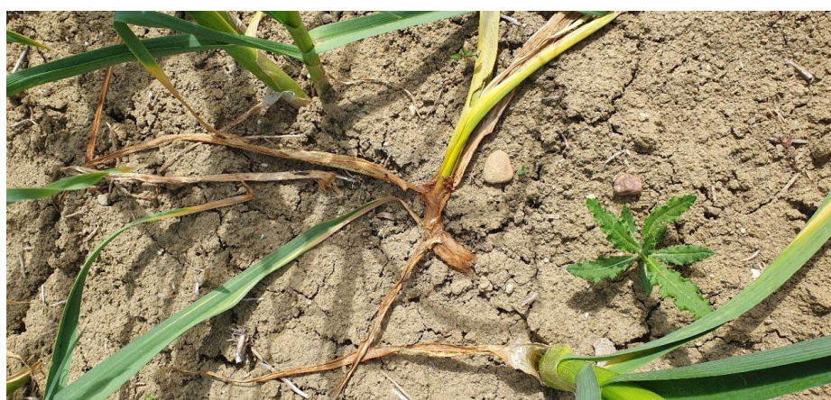
Café au lait : photo alinéa 2024