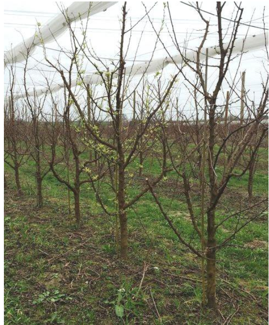
Arbre malade à feuillaison précoce

L'expression des symptômes est importante encore cette année en verger.