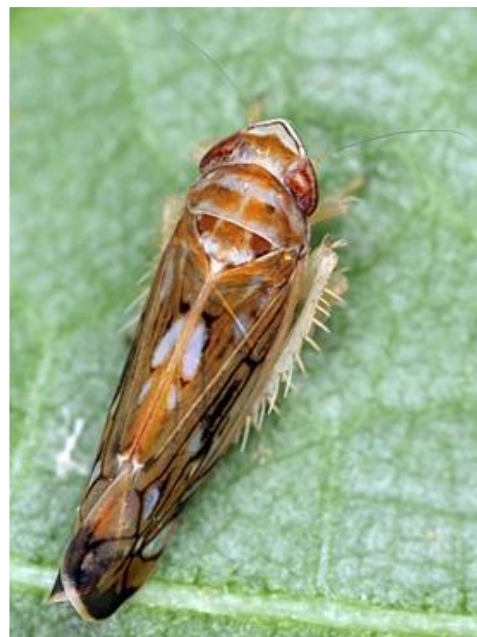
Adulte de Scaphoideus titanus